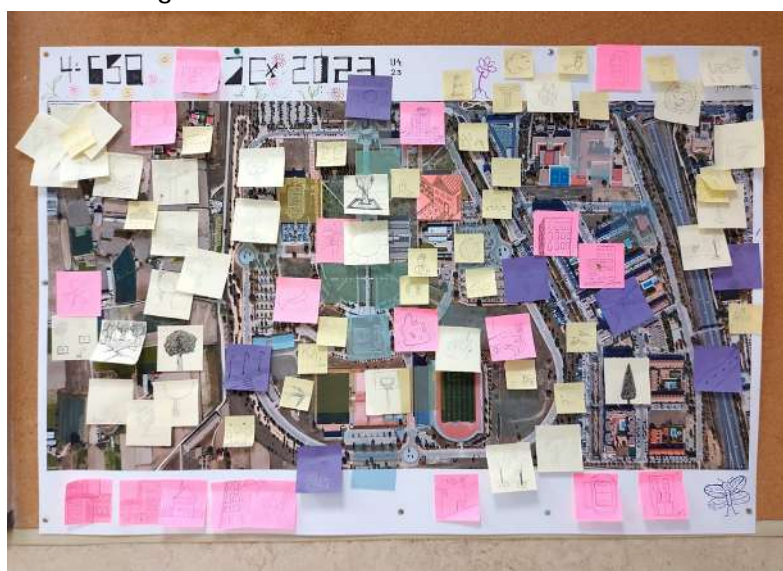
Figura 6: Resultado del Contexto Colaborativo.

Durante los primeros dos ejercicios, los participantes aplicaron los principios educativos de los entornos tecnológicos (TIC) y de aprendizaje creativo y tecnológico (TAC) para abordar el espacio en sus diversas escalas. En el tercer día, se planteó un ejercicio colaborativo para aunar las percepciones espaciales de los participantes en la Microciudad del Campus de Fuenlabrada y evaluar el uso de las herramientas expuestas en las píldoras formativas por parte de los participantes. De esta forma, los voluntarios de grado y profesores no solo supervisaron la actividad, sino que valoraron el proceso y soluciones de representación que el alumnado de secundaria plateaba. En este tercer ejercicio, se relacionaron las escalas en entornos colaborativos, donde los puntos de referencia urbanos y edificatorios se combinaron según los intereses y usos personales de los participantes, fomentando la comprensión cognitiva de la ubicación, la navegación y la comunicación espacial. El principal resultado de la actividad fue que los estudiantes de secundaria redescubrieron su conciencia espacial. Además, utilizando ejemplos digitales para la comunicación en el aprendizaje, los estudiantes resolvieron la representación espacial del campus de Fuenlabrada, tanto en el ámbito urbano como en el edificado.