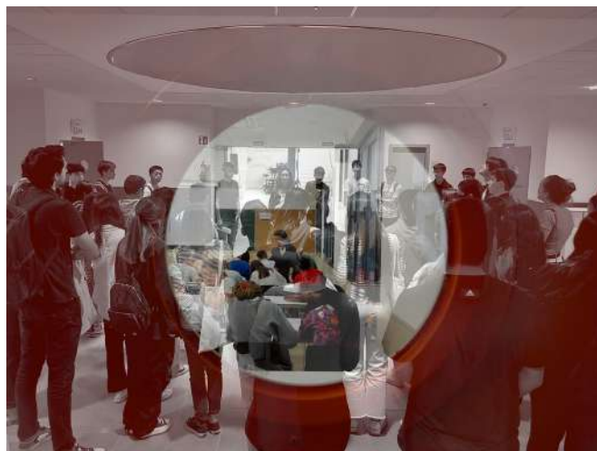
Figura 4: Alumnos de Secundaria Realizando el Ejercicio de Deambulación Construida.

dibujo con el de la herramienta de SketchUp con respecto a su entorno construido (habitación, vivienda, edificio y calle). Además, se fomenta el uso de Minecraft como un medio para desarrollar estrategias espaciales, alentando a los estudiantes a conectar el proceso imaginativo con los principios de la arquitectura y el espacio urbano que han aprendido.