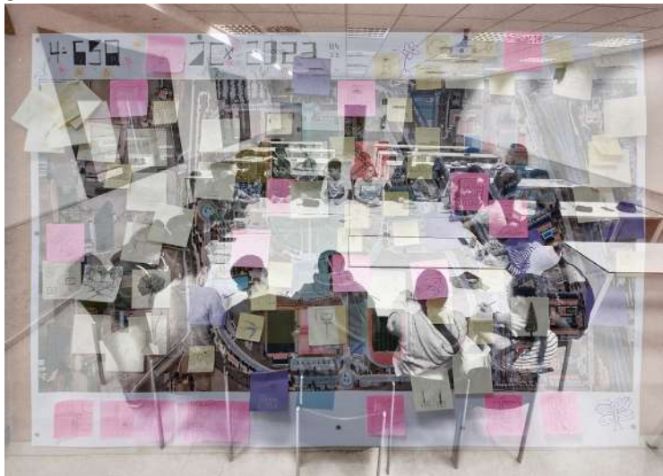
Figura 5: Alumnos de Secundaria Realizando el Ejercicio de Contexto.

Durante el tercer día del programa se ha consolidado el enfoque colaborativo para fomentar la participación y al aprendizaje conjunto entre los estudiantes de 4º de la ESO. Al seguir los preceptos TAC y los fundamentos colaborativos de OpenStreetMaps, se promueve una metodología de trabajo en equipo que involucra a todos los participantes en la construcción de un plano colaborativo del campus de Fuenlabrada. Se proporciona una ortofoto impresa a gran escala, en tamaño A1, para disponer de una base visual sólida para el proyecto. Los participantes utilizaron notas adhesivas para marcar referencias espaciales y establecer recorridos en el mapa en función de los hitos comunes que todos han empleado en sus ejercicios previos.