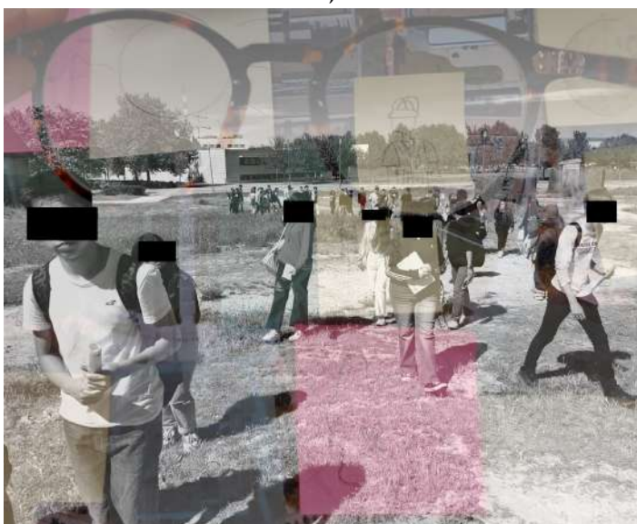
Figura 3: Alumnos de Secundaria Realizando el Ejercicio de Deambulación de Microciudad. 2023.