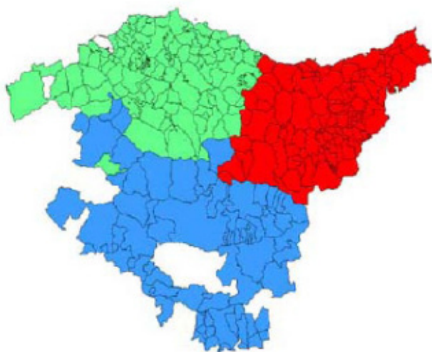
Por territorio histórico