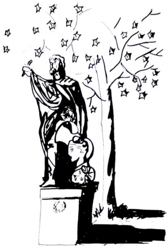
Ramiro I (850), Rey de León