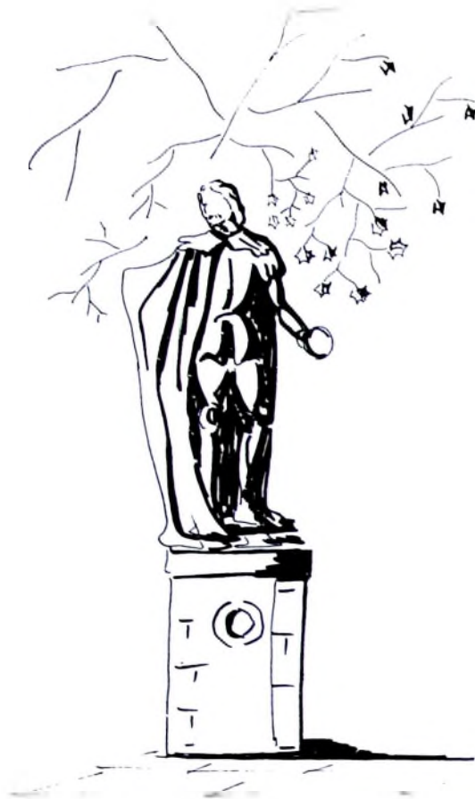
D. Fernando I, Rey de Castilla. S. XI