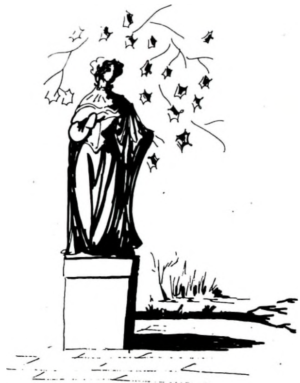
Doña Sancha, Reina de León. S. XI