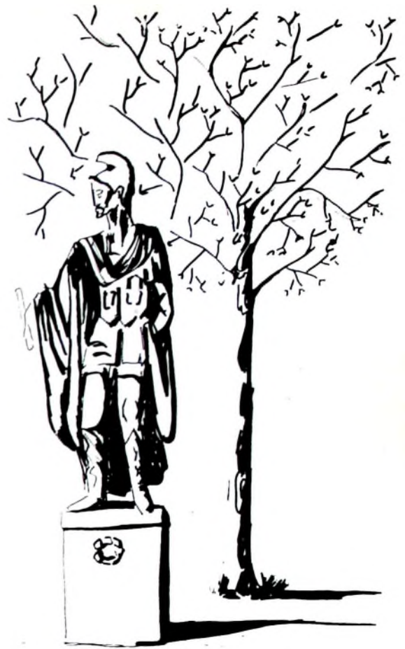
Alfonso II, Rey de León (842)