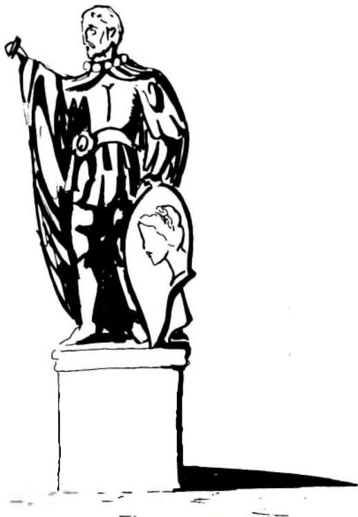
D. Alonso V, Rey de León. S. XI