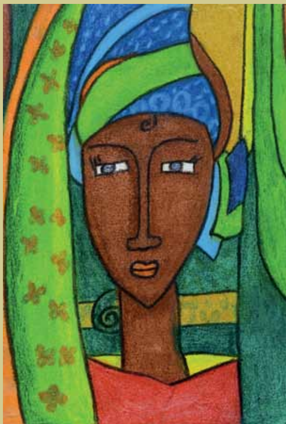
Título: Afro 1 Técnica: Óleo pastel Dimensión: 27 x 40 cm

Fecha de recepción: septiembre 13 de 2013 Fecha de aprobación: octubre 22 de 2013