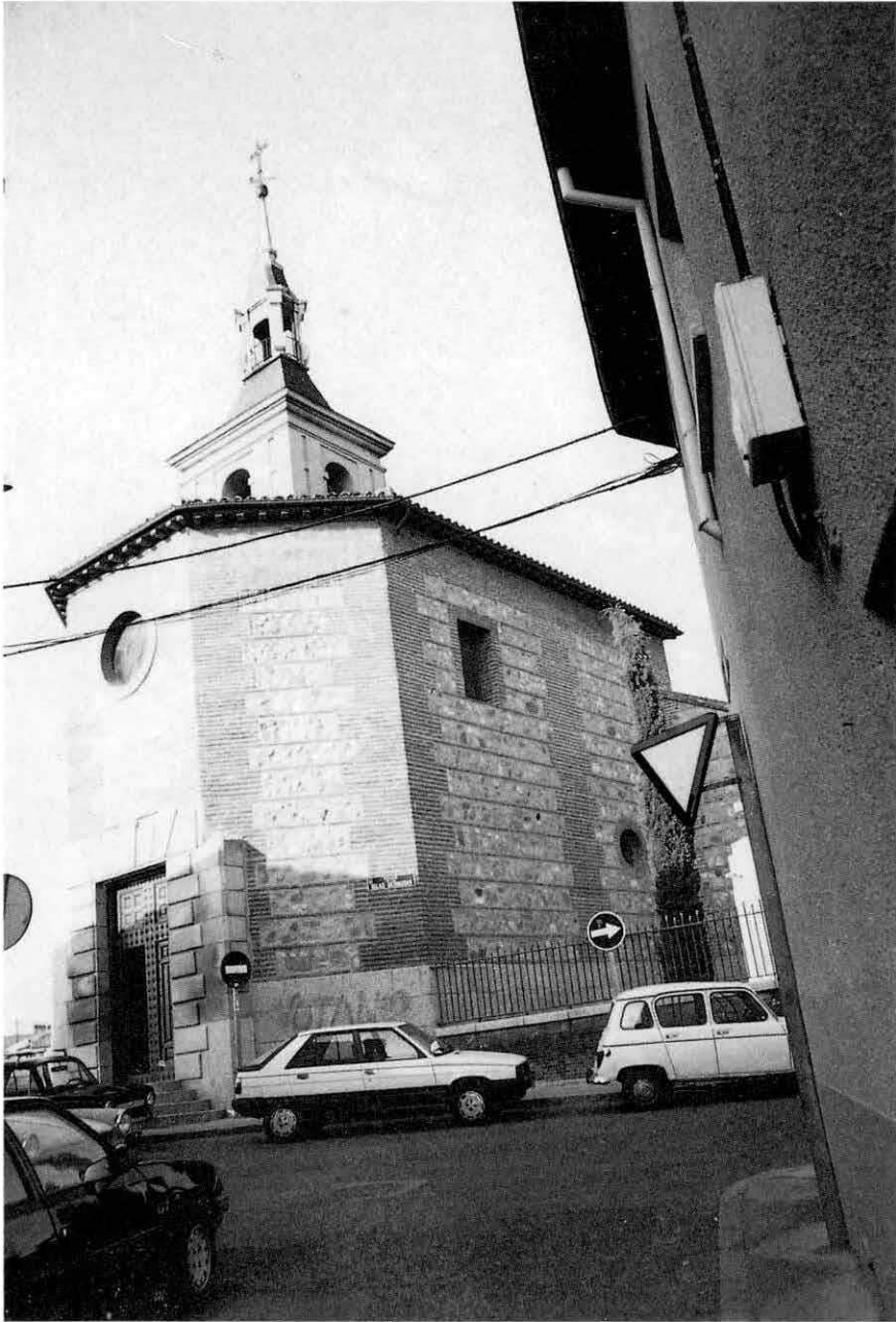
Fuencarral. Iglesia Parroquial de San Miguel. Exterior. Abside primitivo, actual cabecera y entrada al templo.