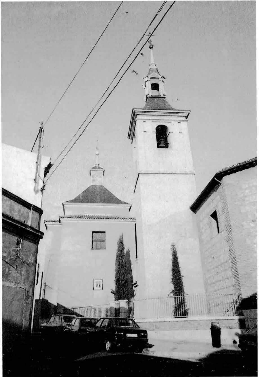
Fuencarral iglesia parroquial de San Miguel. Exterior Torre y Capilla del Cristo