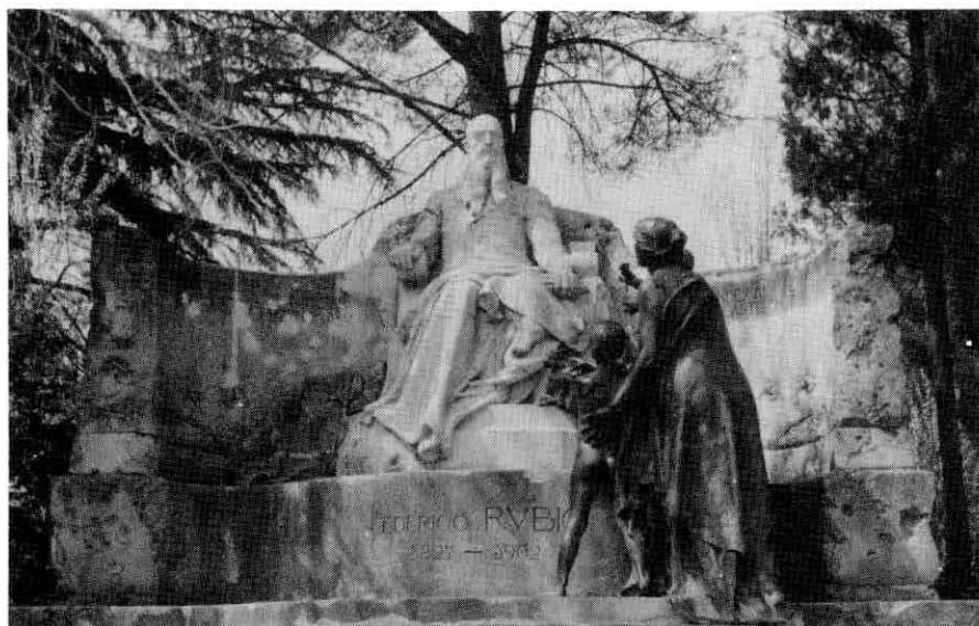
Fig. 1. Monumento al Dr. Federico Rubio.

TANA / 1902 / LA - POETI / SA". En el extremo inferior puede verse la firma del escultor: "Miguel Blay", que se repite en el borde del vestido de la mujer.