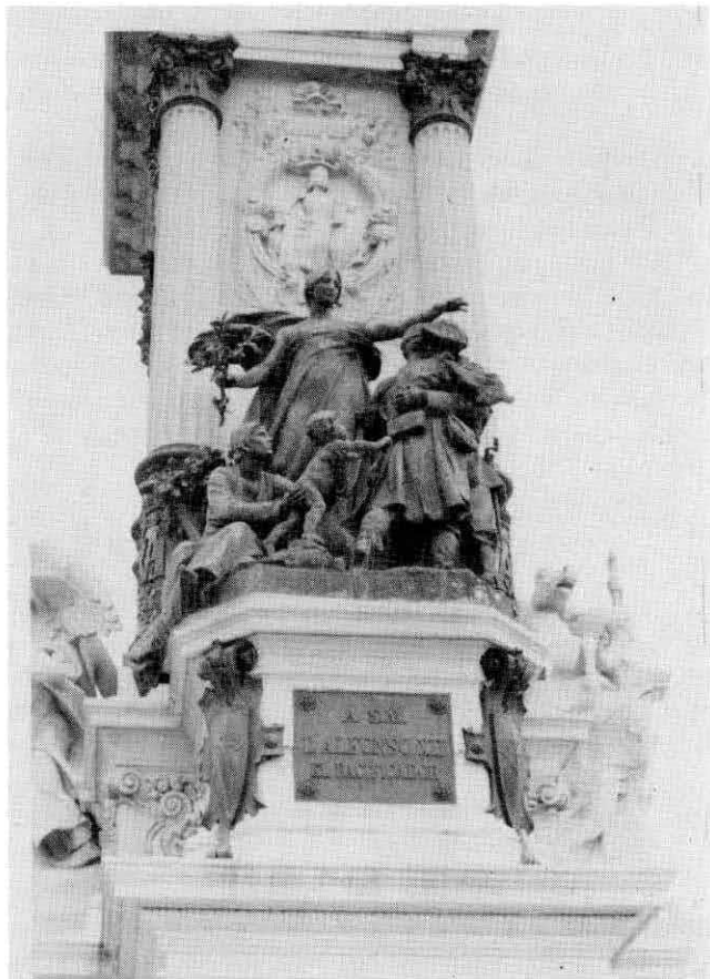
Fig. 4. Monumento a Alfonso XII. Grupo de «La Paz».

grientas guerras civiles. En el primero, colocado en el monumento en 1910 4 el abrazo tiene lugar bajo la mirada y el brazo protector de la Paz, y es contemplado por una joven madre con su hijo en brazos (Fig. 4). En el segundo, el Rey se descubre ante la Patria, que lleva el escudo de Madrid y va acompañada por dos niños y las figuras de la Paz arrojando flores, Mercurio -Dios de la Industria- y Apolo -Dios de las Artes-. Detrás del Rey los dos jóvenes soldados se abrazan y debajo de ellos aparece la fecha “20 de Marzo / 1876”, haciendo referencia a la finalización de la III guerra Carlista.