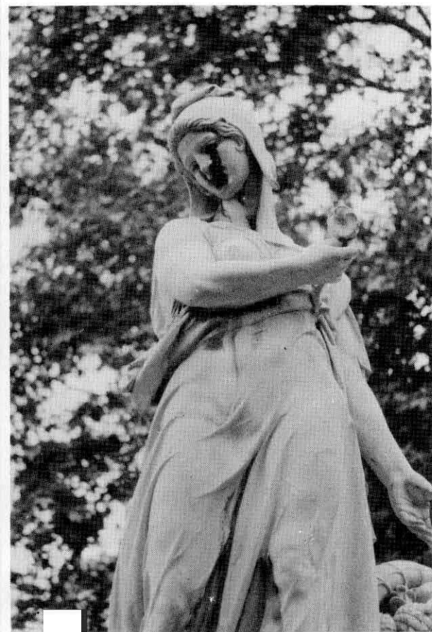
Fig. 5. Monumento a Cuba. Figura alegórica de «Cuba».