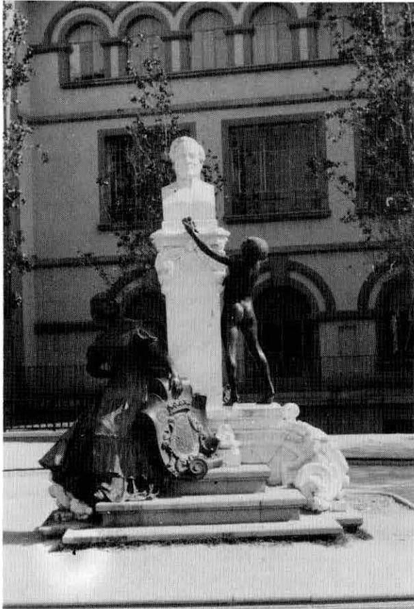
Fig. 2. Monumento a Mesonero Romanos.

Consta de un pedestal de piedra, escalonado, y sobre el último escalón dos grandes volutas que sirven de base al pilar sobre el que se eleva el busto del homenajeado, en mármol. En el frente del pilar se lee: “A / D. RAMÓN DE / MESONERO ROMANOS / (EL CURIOSO PARLANTE) / 1803-1882 / EL AYUNTAMIENTO DE / MADRID 1914” (fig. 2). En la parte posterior del monumento, sobre los escalones, hay una gran rama de laurel, con un tintero, plumas y unos papeles escritos en letra cursiva: “Usufructuario de nada; / soy honorario de todo; / figuro en cartas de pago; nunca en nóminas de cobro. / (Del romance “Mi independencia)”, todo ello en bronce.