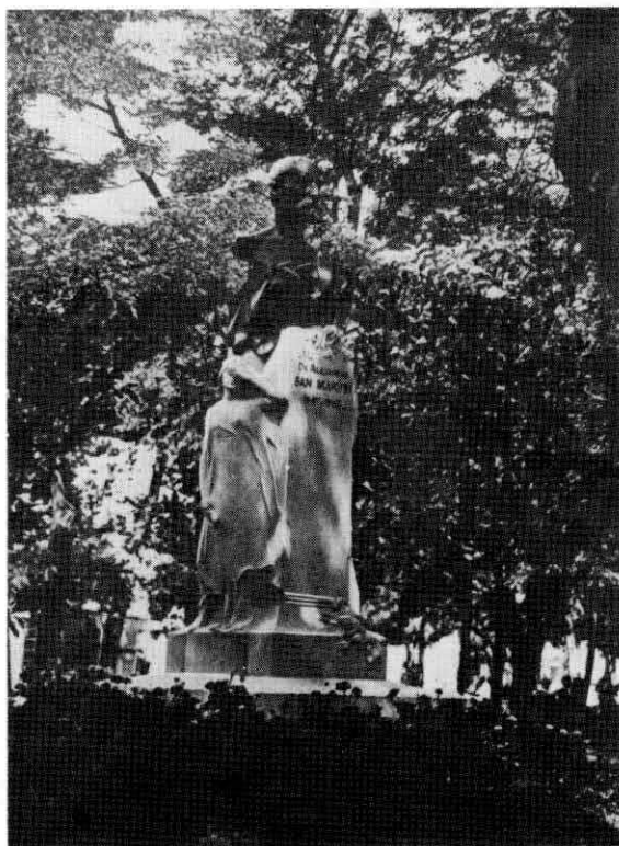
Fig. 6. Monumento al Dr. San Martín.