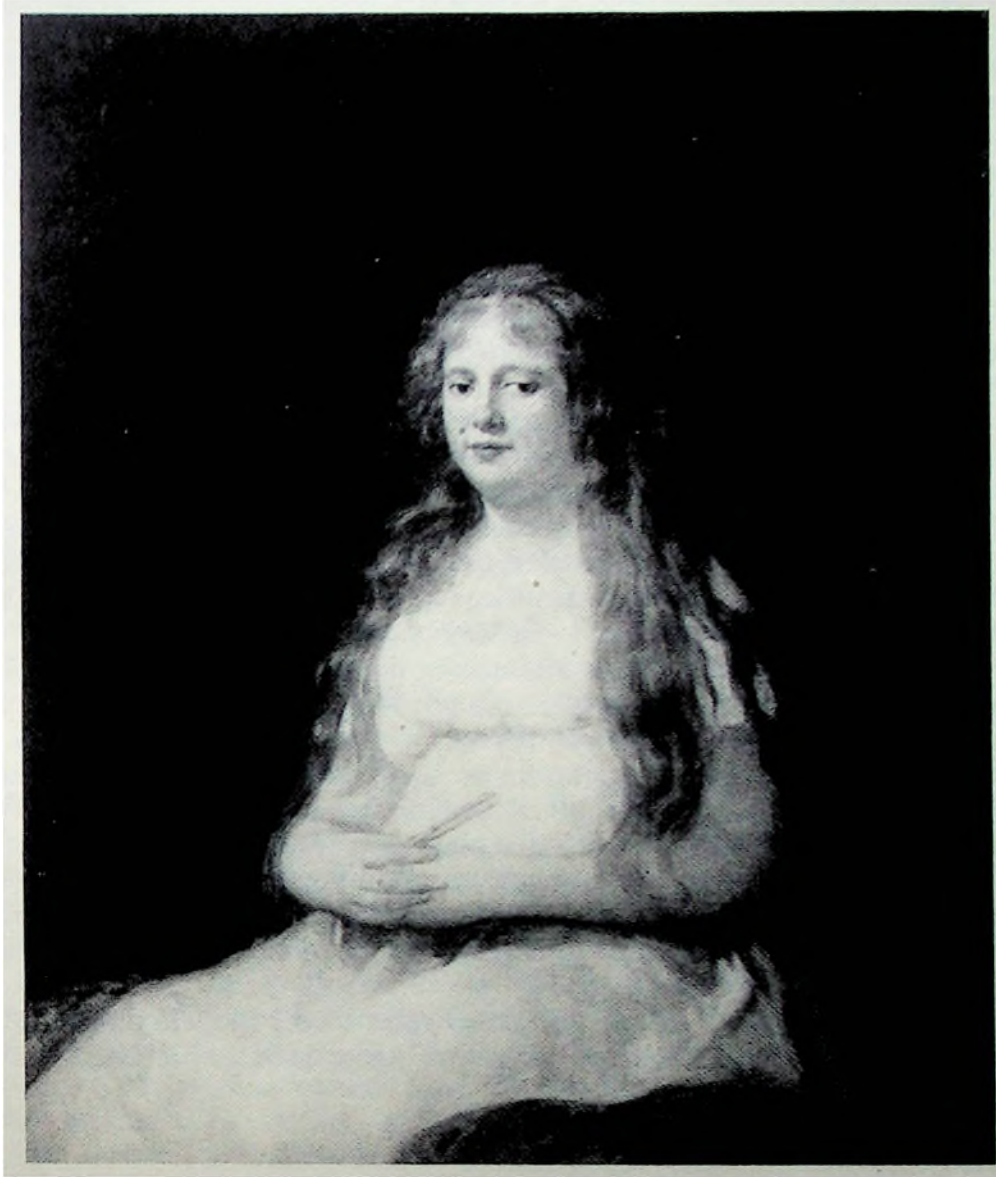
Goya. Josefa Castilla de Portugal de Garcia. New York. The Metropolitan Museum of Art.