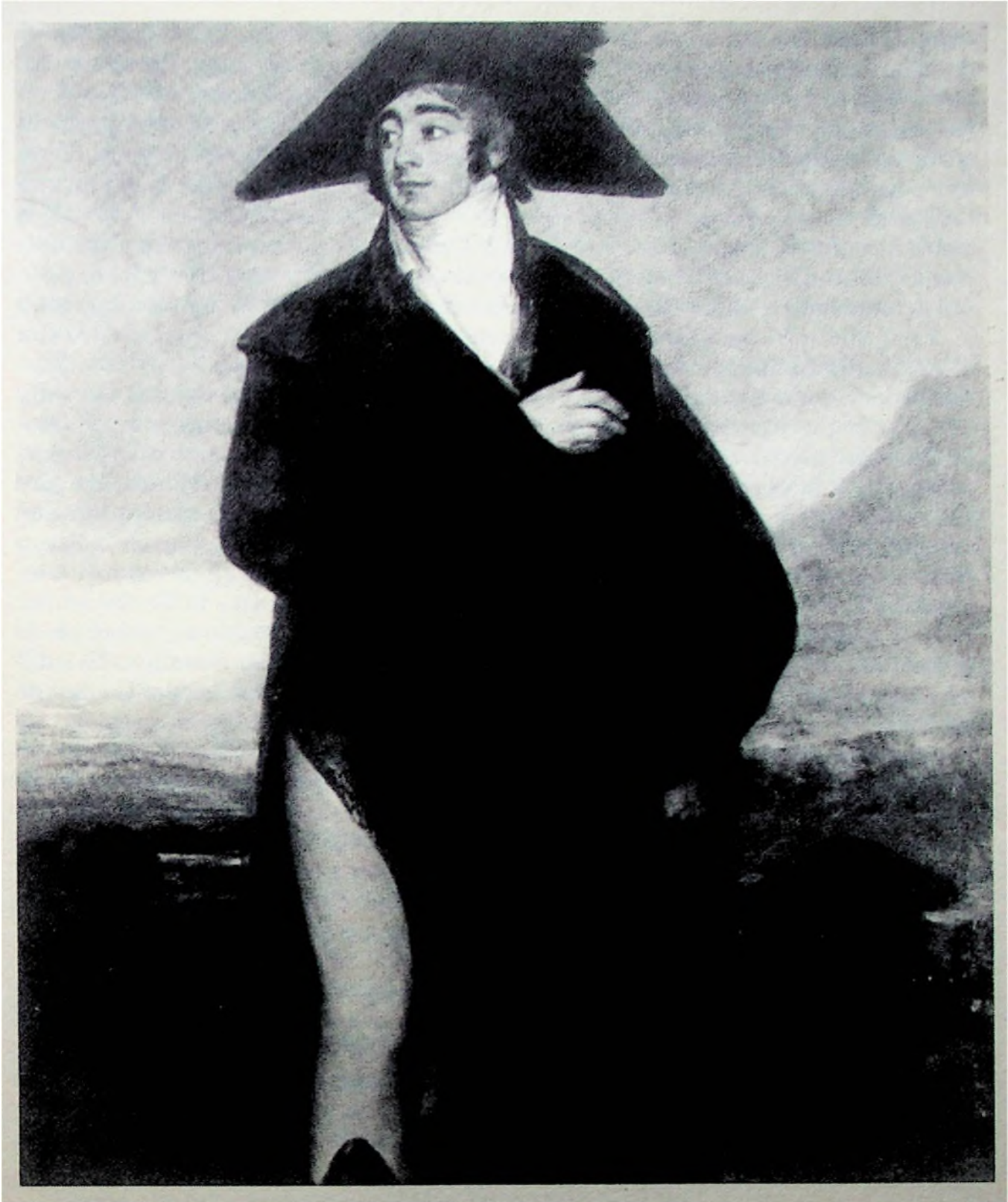
Goya. Carlos Gutierrez de los Ríos I Duque de Fernán Núñez.