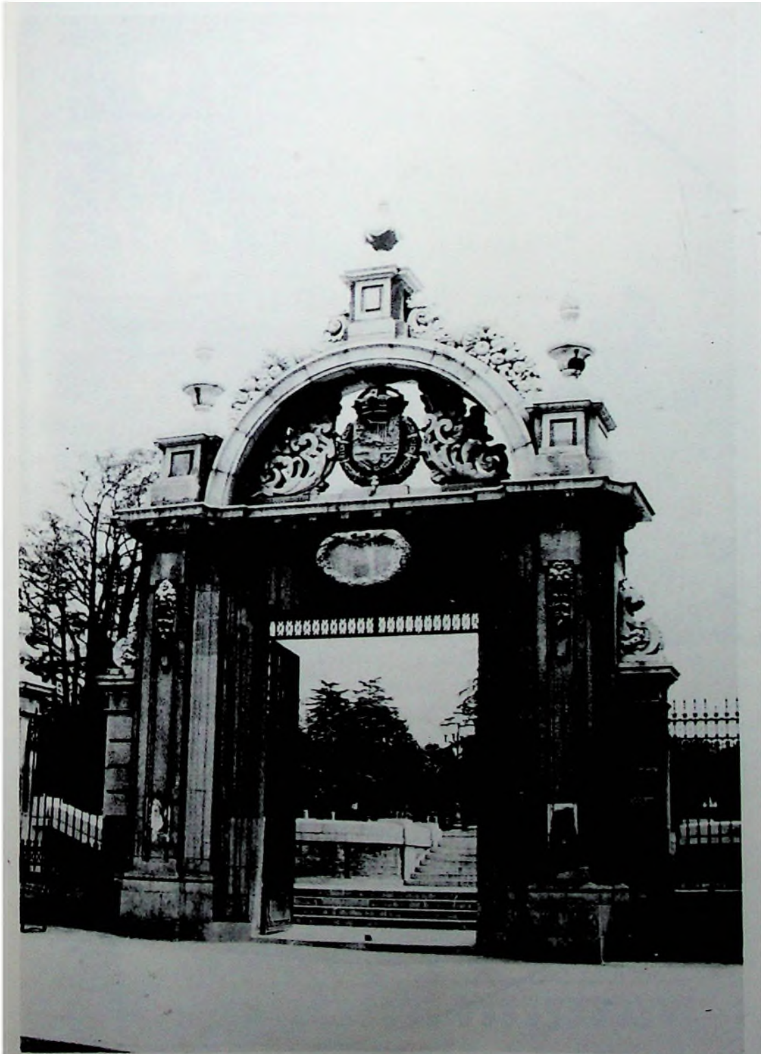
Puerta en honor de Ana de Noeburgo (Melchor de Bueras; reconstrucción de J. Bellido).