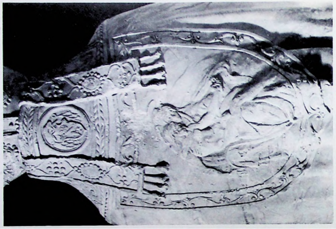
Figs. 2 y 3.—Gregorio Vigarny y Esteban Jameie. Detalle de la estatua de D. Alonso de Castilla.