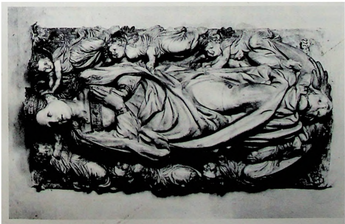
FIG. 4.—Gregorio Vignary. La Asunción. Madrid. Museo Arqueológico. (Procede de Santo Domingo el Real.)