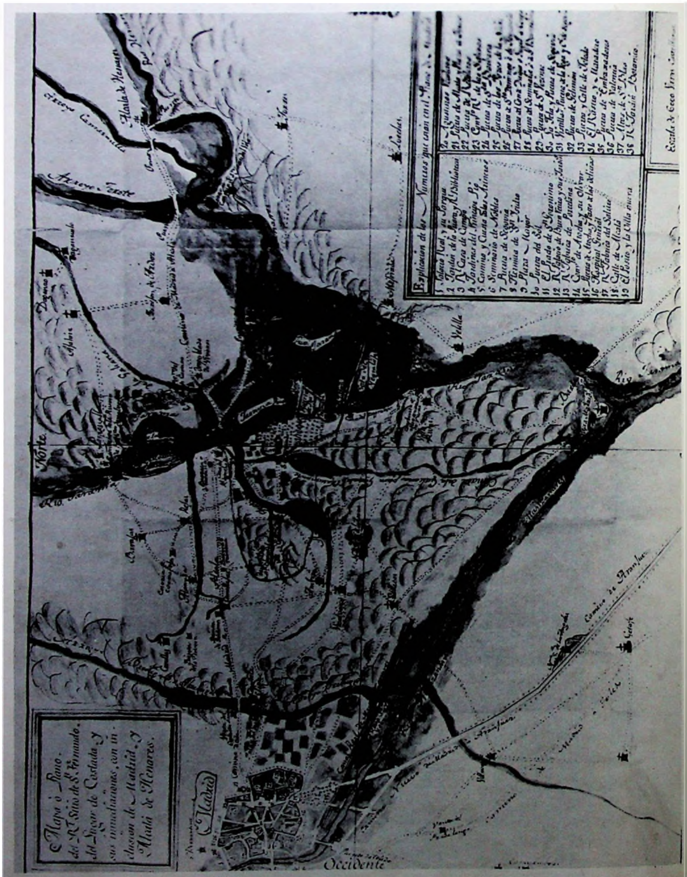
Fig. 2—Plano del Real Sitio de San Fernando, en donde se puede apreciar el plano de Madrid y sus contornos, orientados (copio XVII)