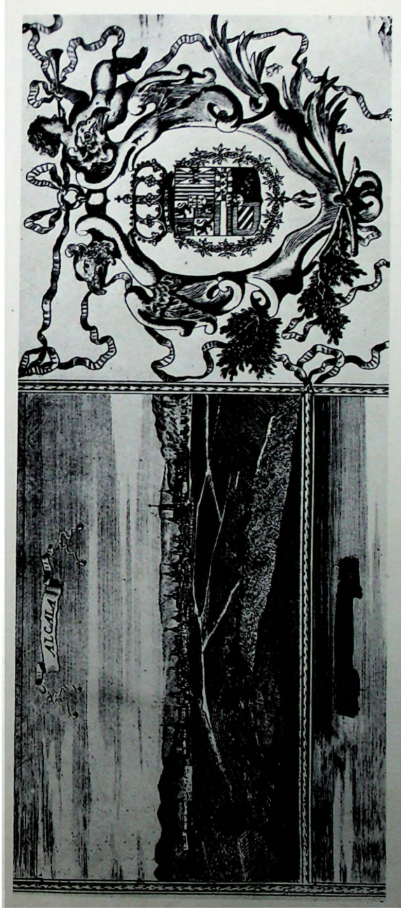
Fig. 1.—Panorámica de la ciudad de Alcalá (detalle del mapa del cardenal Portocarrero, de comienzos del siglo XVIII).