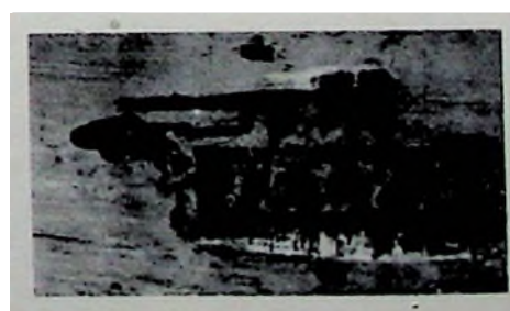
FIG. 3.—Marca del platero Luis de Zabalza.