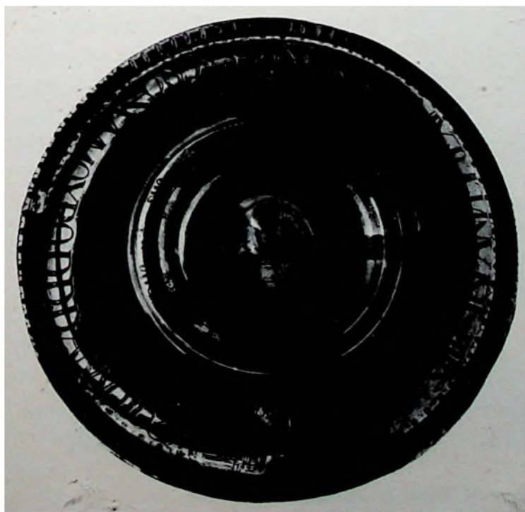
FIG. 2.—Detalle del pie.