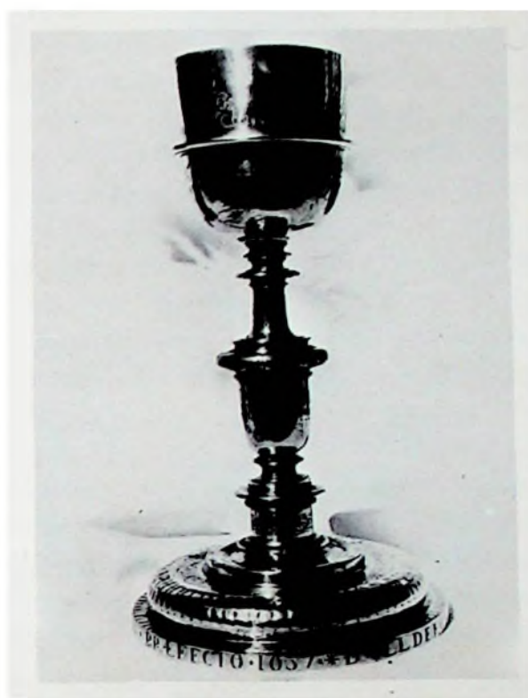
FIG. 1.—Luis de Zabalza. Cáliz limosnero de 1637. Colegiata de Pastrana (Guadalajara).