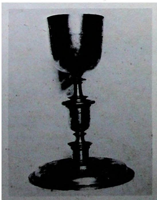
FIG. 5.—¿Seguidor de Luis de Zabalza? Cáliz. Hacia 1640. Iglesia Magistral de Alcalá de Henares (Madrid).