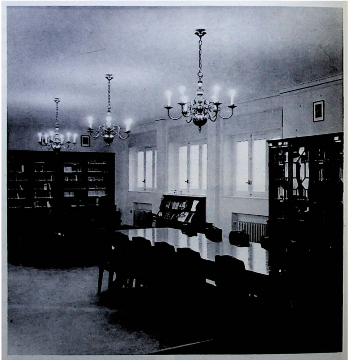
Biblioteca Pública Municipal de San Lorenzo de El Escorial.