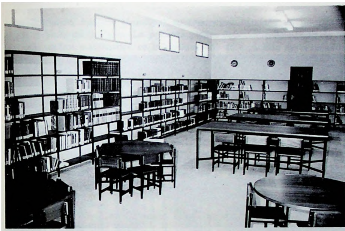
Biblioteca Pública Municipal de Colmenar de Oreja.