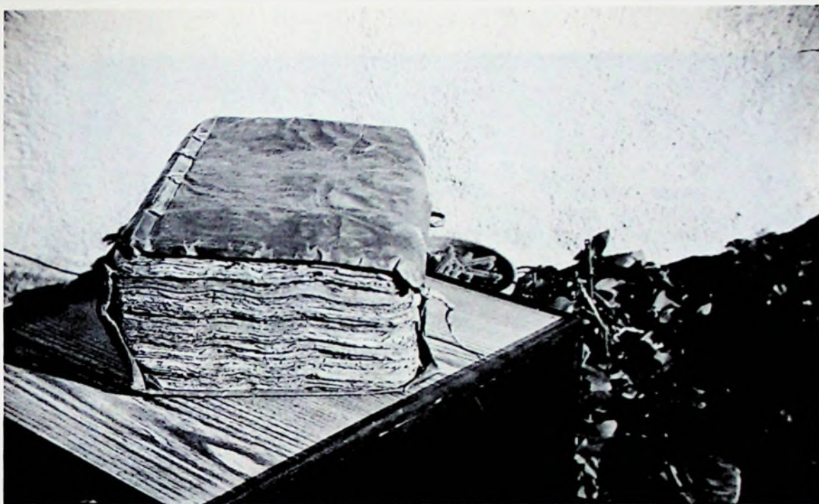
GETAFE.—Manuscrito, siglos XVI-XVII. Archivo Histórico Parroquial de la Magdalena.