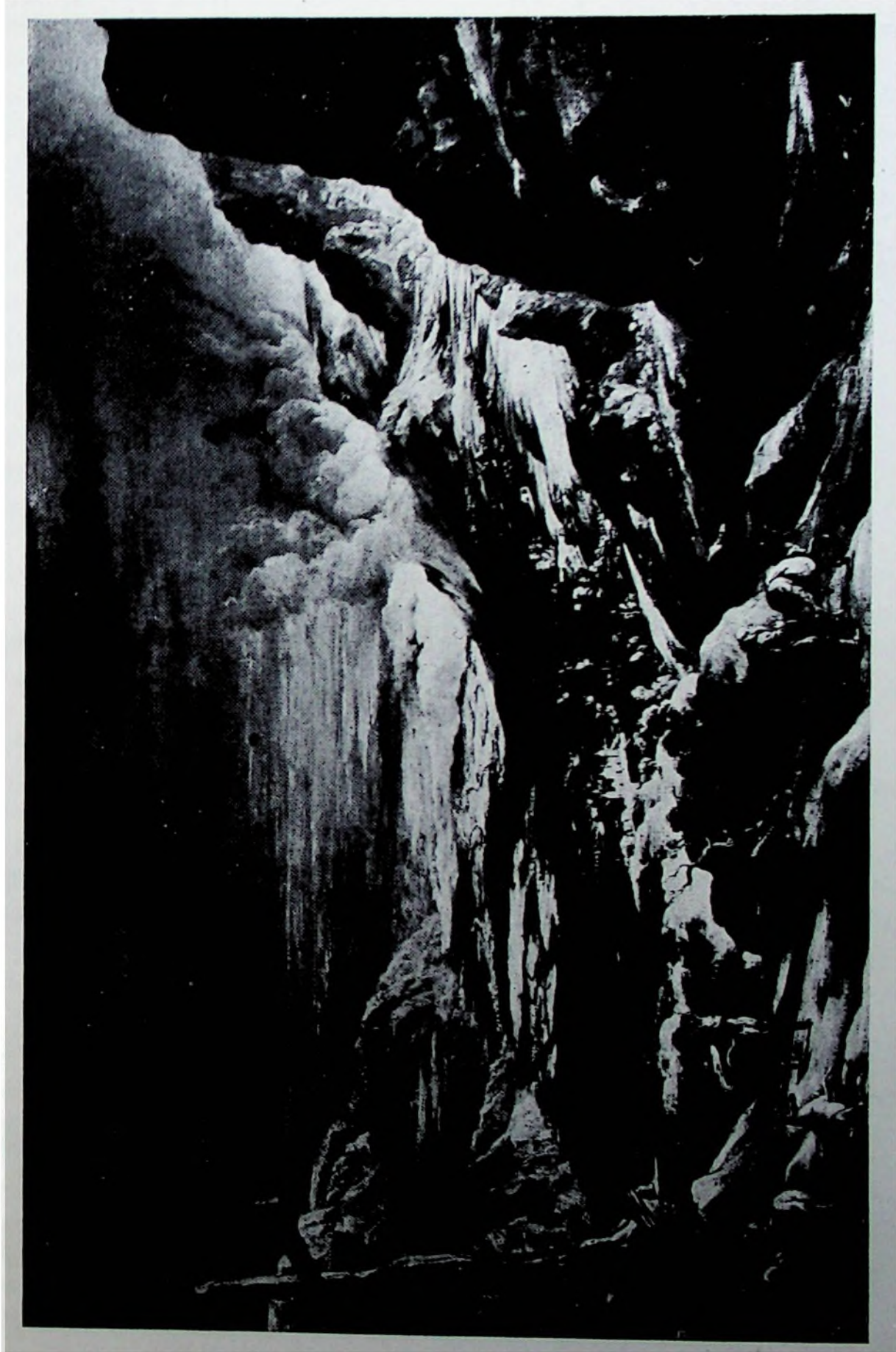
Vista de El Escorial con la Cruz de Felipe II, por Rubens (1629).