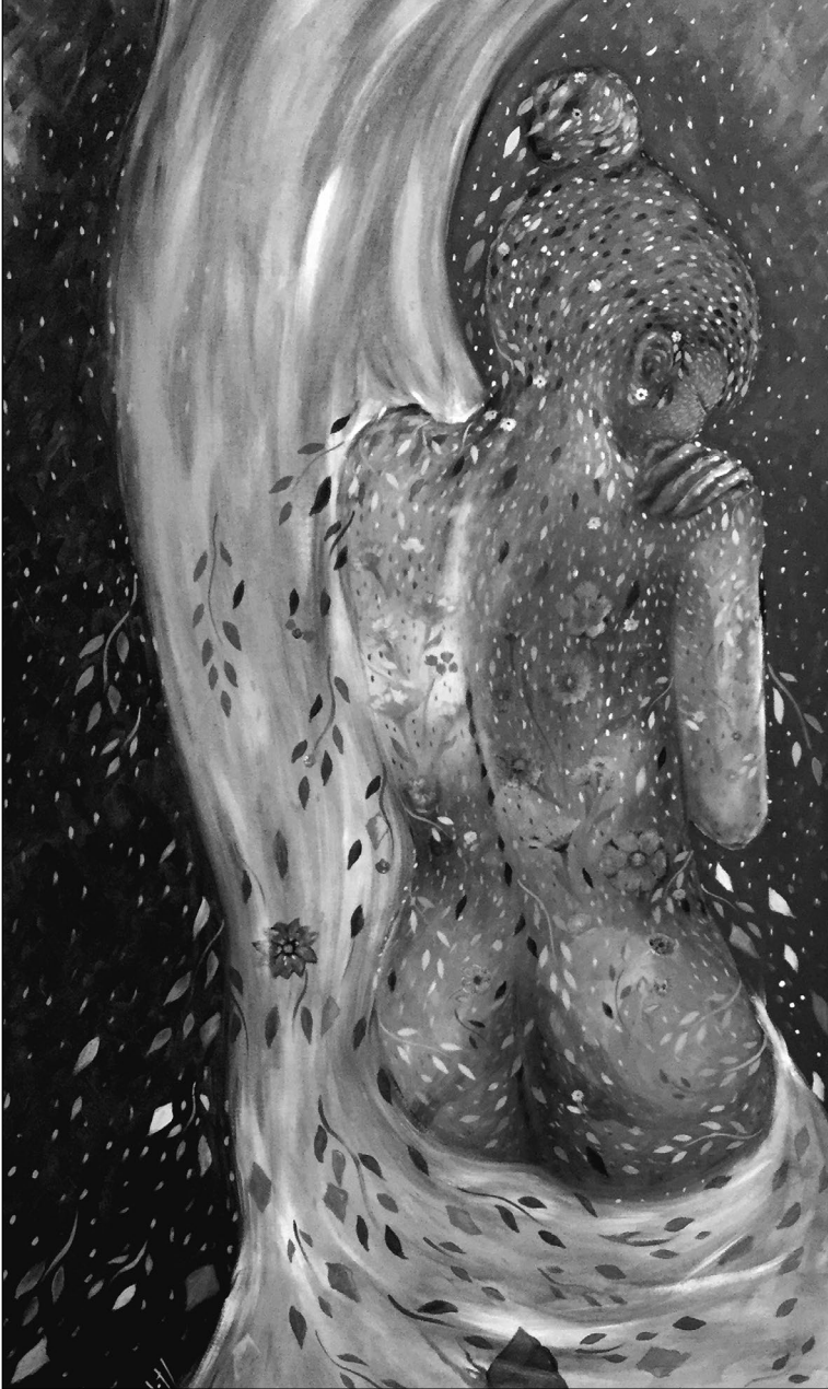
El recuerdo de la serie Nuevo Día (s. f.). Acrílico sobre MDF: Luis Castro Xólotl. Prohibida su reproducción en obras derivadas.