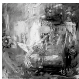
Portada: El hurto de la serie Nuevo día (s. f.). Acrílico sobre MDF: Luis Castro Xólotl.

Pliego de Poesía , núm. 129, enero-marzo de 2026, es una separata de La Colmena , que es una revista de publicación trimestral editada por la Universidad Autónoma del Estado de México (UAEMEX), Instituto Literario núm. 100 Ote., colonia Centro, Toluca, Estado de México, c. p. 50000; Tel.: (722) 277 3835; página de internet: https://www.uaemex.mx ; correo electrónico: lacolmena@uaemex.mx . Editora responsable: Marcela Pineda Téllez, Edificio UAEMITAS, 3er piso, Leona Vicario 201, Barrio de Santa Clara, c. p. 50090, Toluca, Estado de México, Tel.: (722) 481 1800, Ext. 19311. ISSN: 1405-6313; e ISSN: 2448-6302, y Reserva de Derechos al Uso Exclusivo No. 04-2015-060512014300-203, ambos otorgados por el Instituto Nacional del Derecho de Autor (INDAUTOR). Las opiniones expresadas por los autores no necesariamente reflejan la postura de los editores responsables de la publicación. Se autoriza la reproducción total o parcial del contenido aquí publicado sin fines de lucro, siempre y cuando no se modifique, se cite la fuente completa y su dirección electrónica en términos de la licencia aplicable.