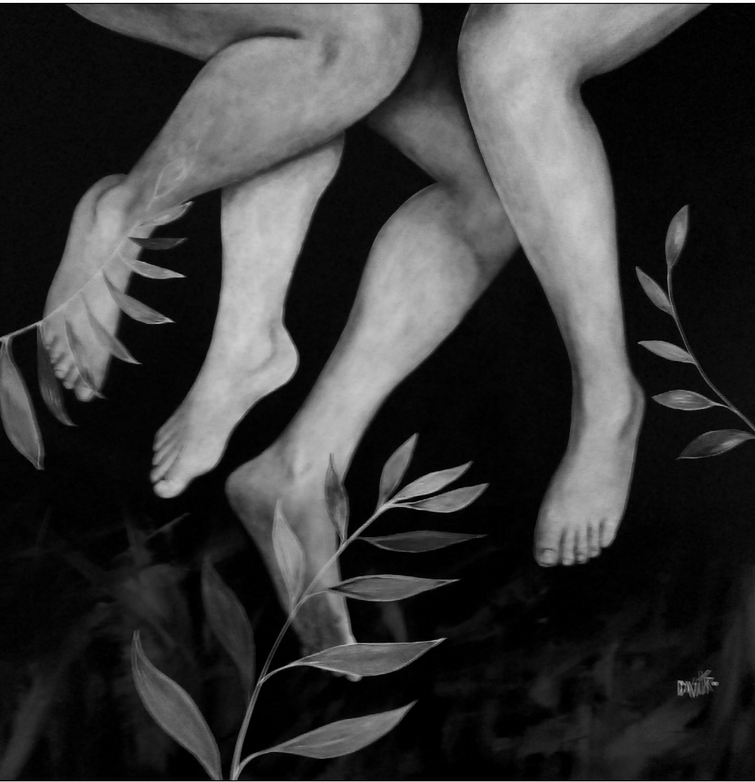
La fiesta 2 de la serie Protesta Blanca (s. f.). Acrílico sobre madera: Luis Castro Xólotl. Prohibida su reproducción en obras derivadas.