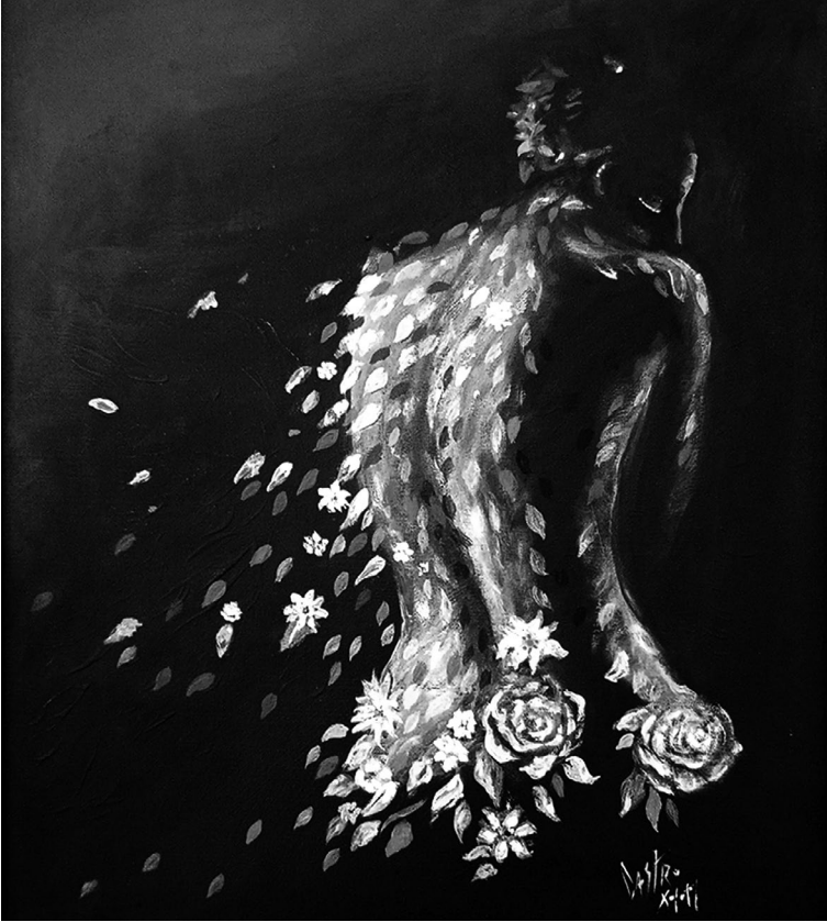
Meditación de la serie Nuevo Día (s. f.). Acrílico sobre lienzo: Luis Castro Xólotl. Prohibida su reproducción en obras derivadas.