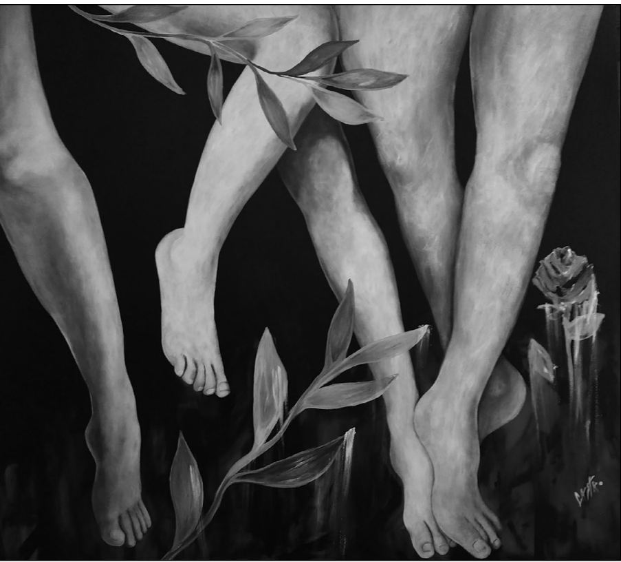
La fiesta 3 de la serie Protesta Blanca (s. f.). Acrílico sobre madera: Luis Castro Xólotl. Prohibida su reproducción en obras derivadas.