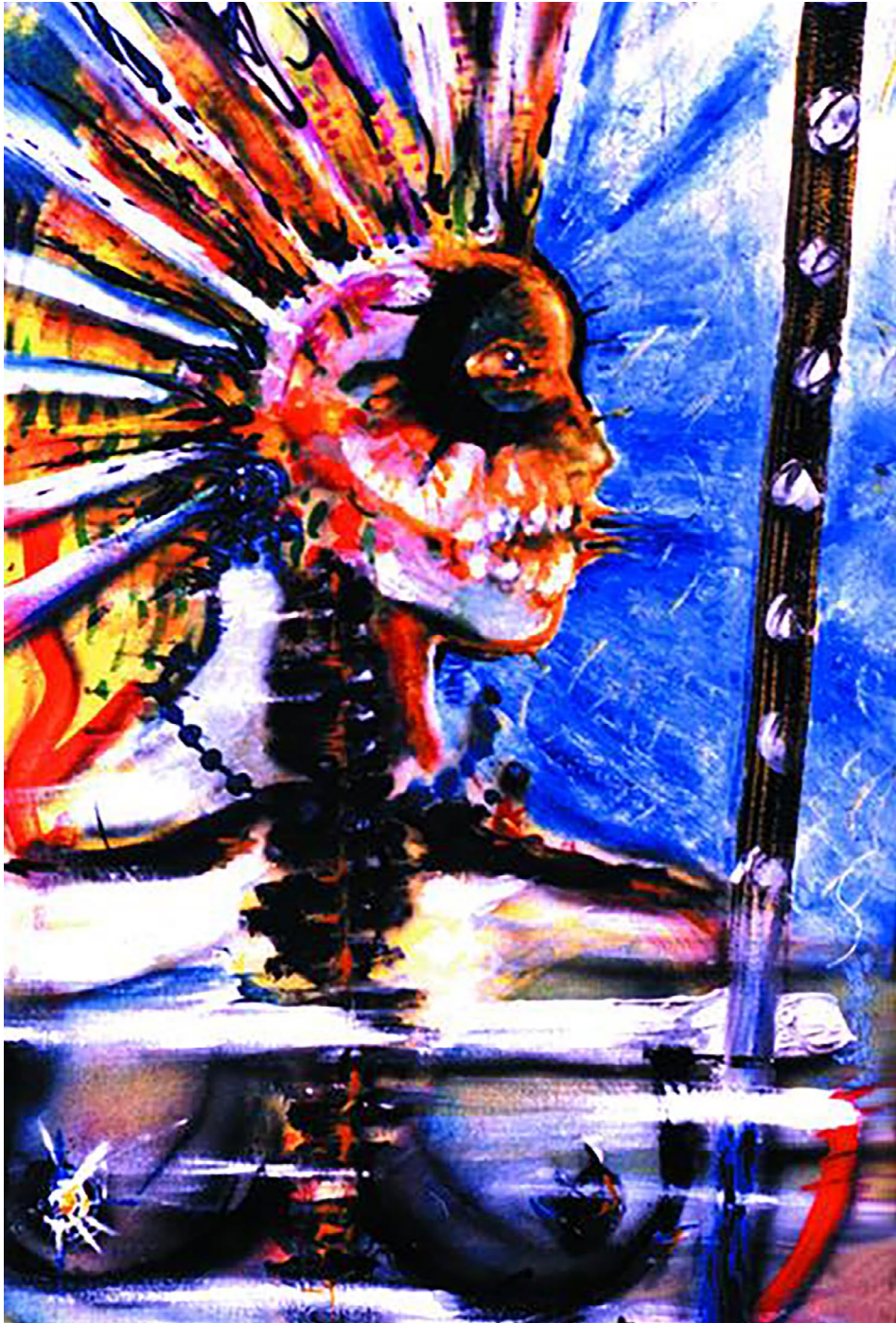
Cantos y flores de la serie Maquillaje ritual (s. f.). Acrílico sobre lienzo: Luis Castro Xólotl. Prohibida su reproducción en obras derivadas.