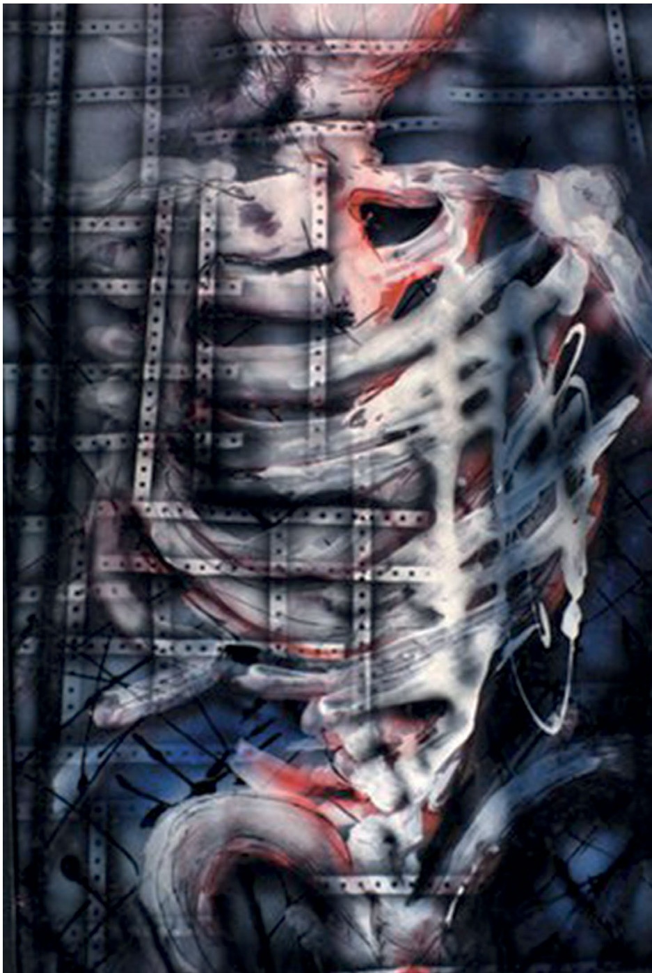
La huida de la serie Los inicios (s. f.). Mixta sobre papel: Luis Castro Xólotl. Prohibida su reproducción en obras derivadas.