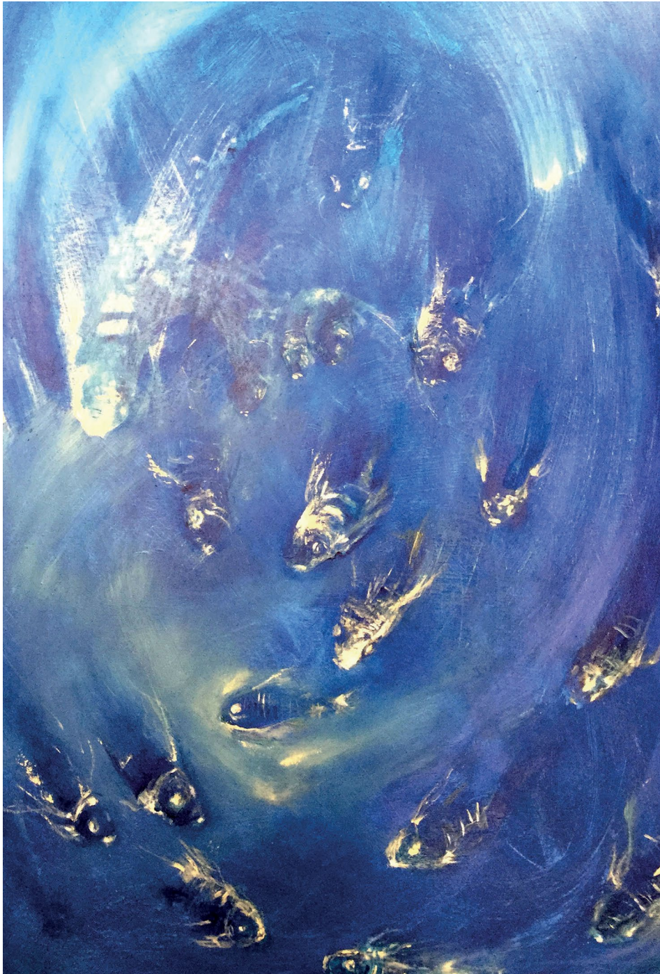
Plegaria de la serie Profundo mar (s .f.). Acrílico sobre madera: Luis Castro Xólotl. Prohibida su reproducción en obras derivadas.