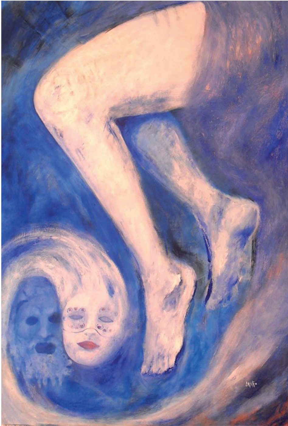
El origen de la serie Profundo mar (s. f.). Acrílico sobre madera: Luis Castro Xólotl. Prohibida su reproducción en obras derivadas.