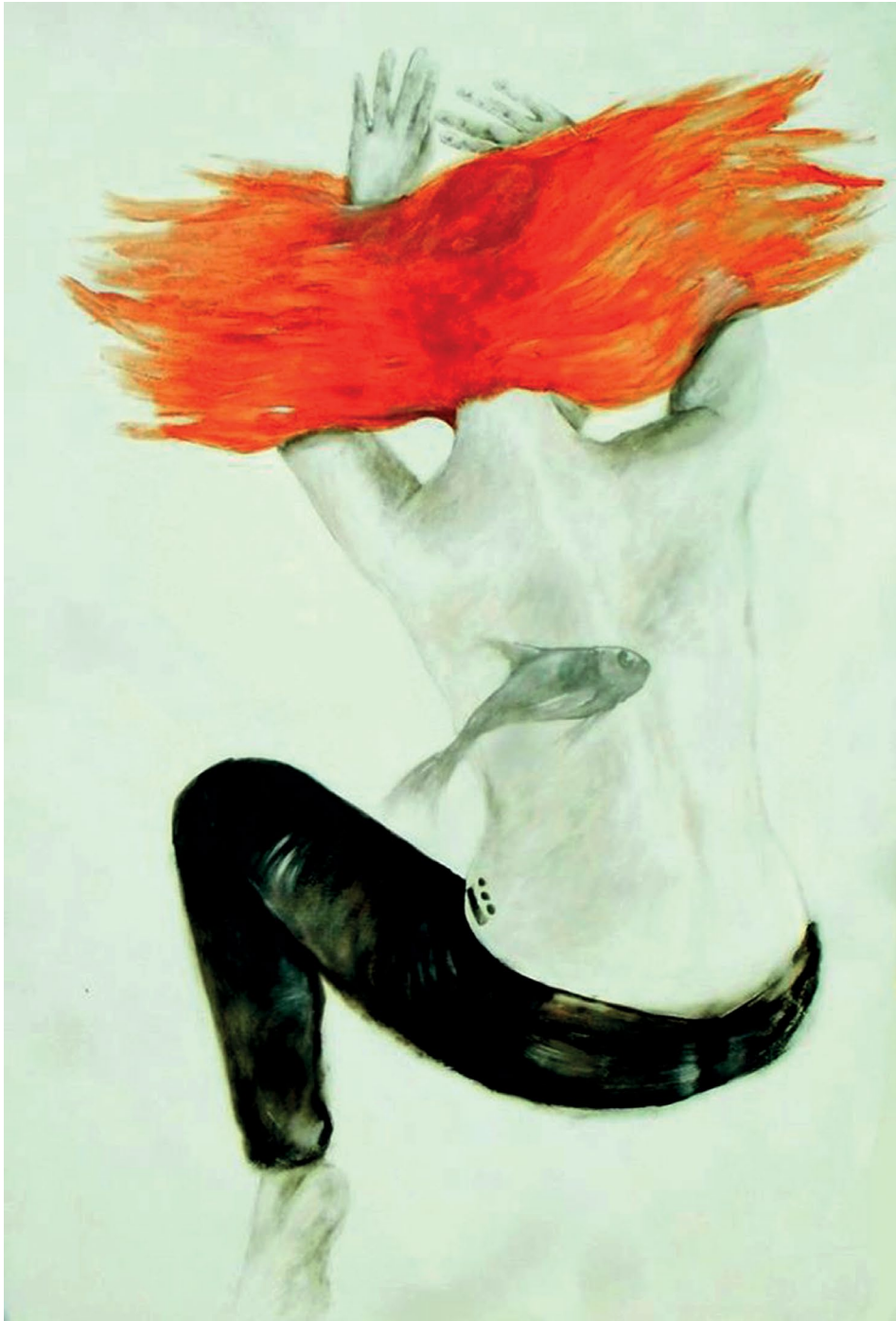
Gravitación de la serie Profundo mar (s. f.). Acrílico sobre madera: Luis Castro Xólotl. Prohibida su reproducción en obras derivadas.