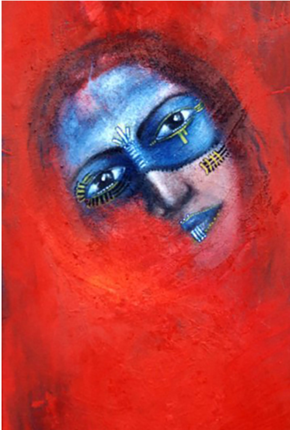
Diosa de fuego de la serie Maquillaje ritual (s. f.). Acrílico sobre madera: Luis Castro Xólotl. Prohibida su reproducción en obras derivadas.