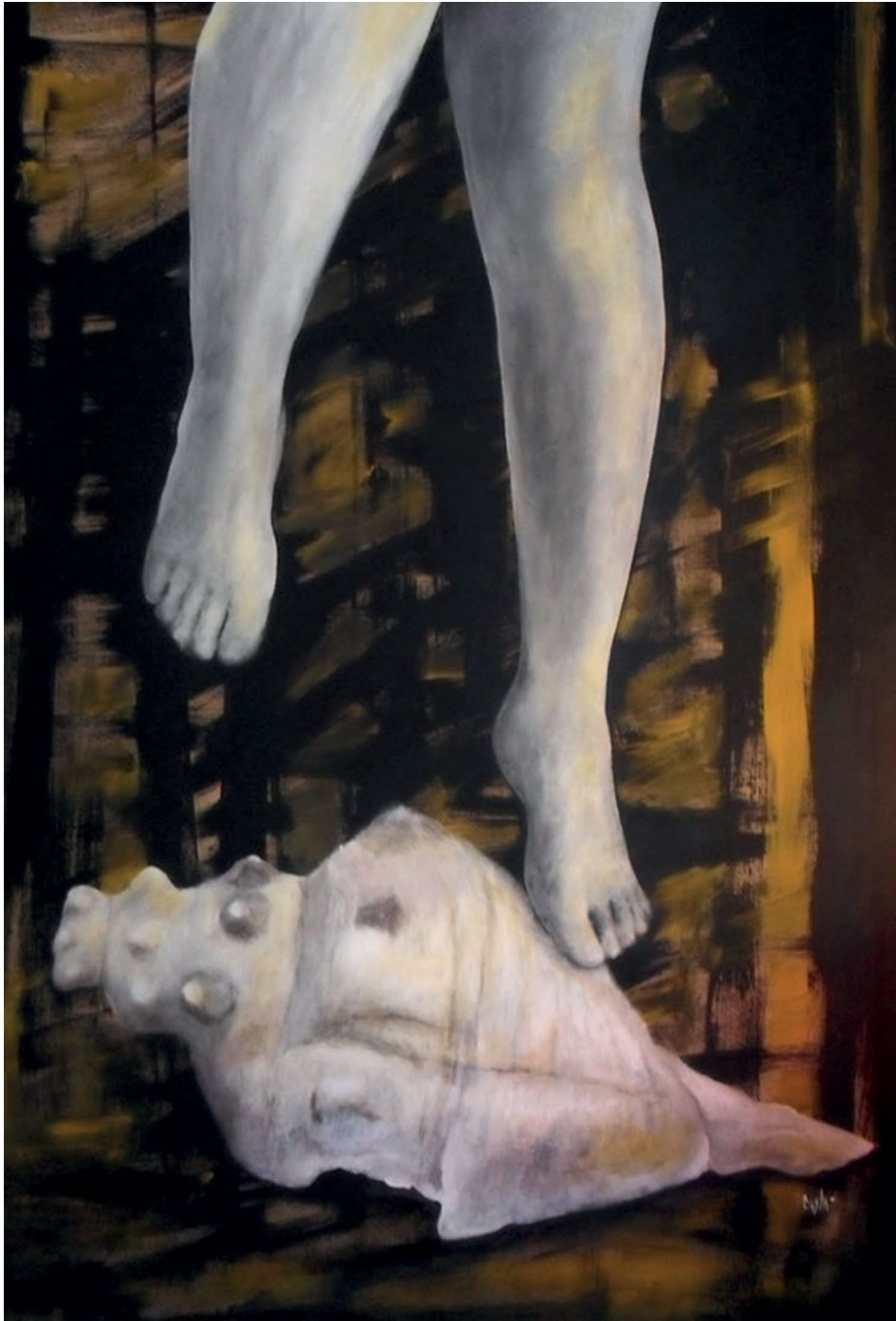
Caracol, la aventura de la serie Profundo mar (s. f.). Acrílico sobre madera: Luis Castro Xólotl. Prohibida su reproducción en obras derivadas.