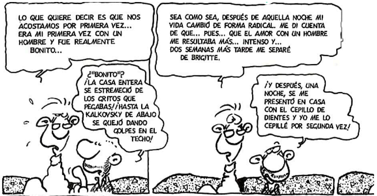
Una vinyeta on apareixen els personatges de Konrad und Paul .

D'aquesta manera, König va trencar l'autocomplaença del col·lectiu amb el seu propi gueto, amb aquella identitat basada en el sexe, les nits i les drogues, i va mostrar que els problemes d'una persona gai no eren, en realitat, tan diferents dels de qualsevol altra persona: embolics amorosos, que si exclusivitat o parella oberta, que si allò va de debò, que si cal anar o no a teràpia, les relacions familiars, la influència de la religió institucional, o la pesadesa d'una feina anodina. D'això se n'encarregaren, sobretot, dos dels seus personatges més estimats: la parella formada per Konrad i Paul. El primer és un tipus corrent, diürn i assenyat que pateix les constants infidelitats del seu xicot. El segon, obsessionat amb la nit, les drogues i el sexe efímer. En fi, relacions descompassades: no cal ser gaire gai per connectar amb la història.