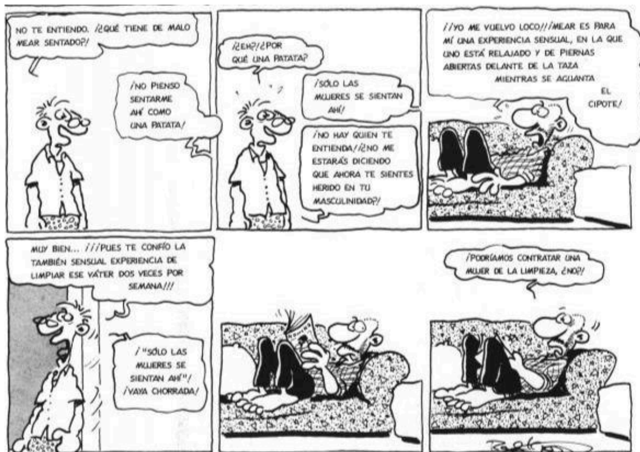
Una escena de Konrad und Paul .

crueltat, segons assenyalen Quim Puig i Virginia Puig a l'estudi «Sexo y misoginia en la obra de Ralf König».