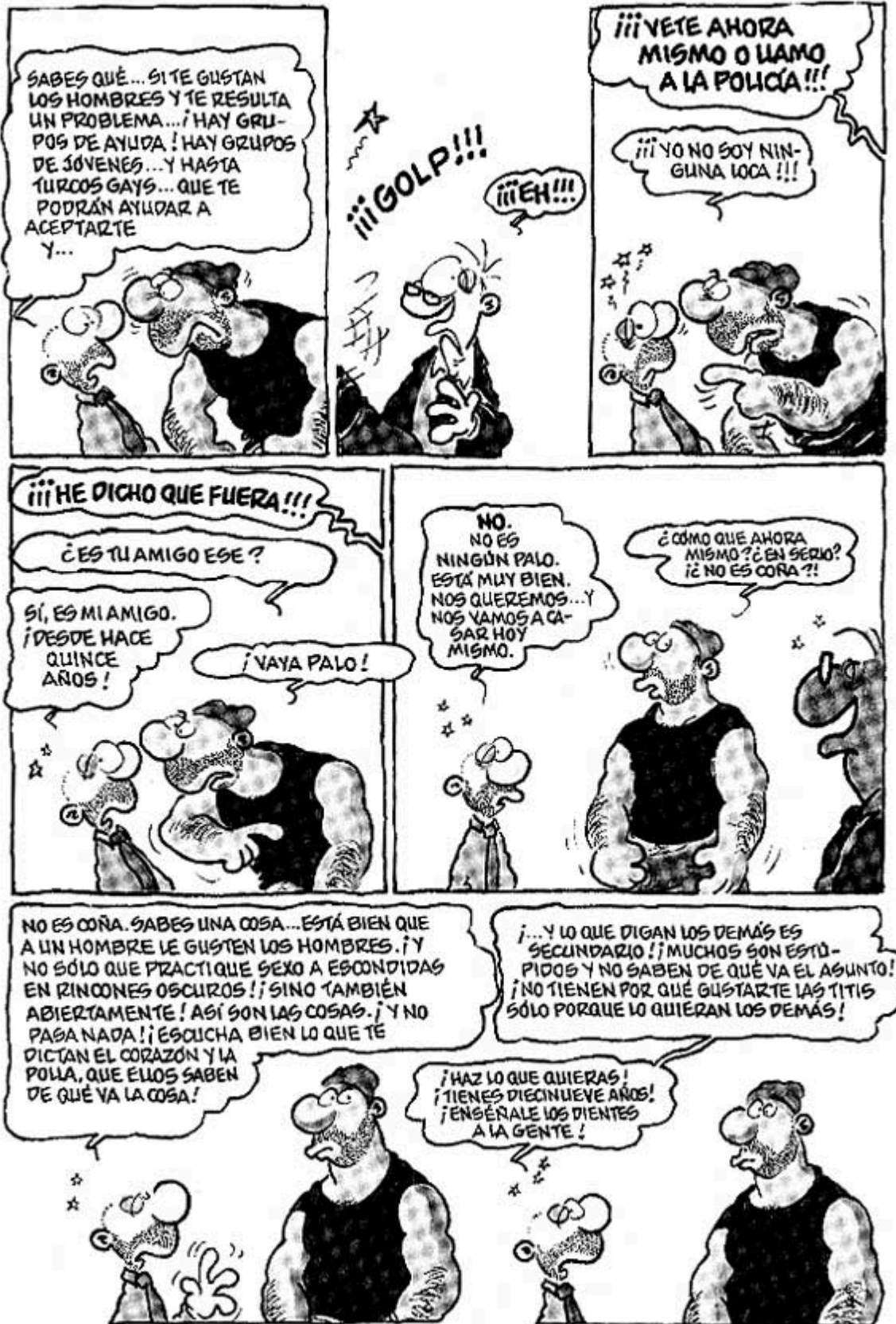
El tractament de l'homofòbia a Sie dürfen sich jetzt Küssen (Podéis besaros).