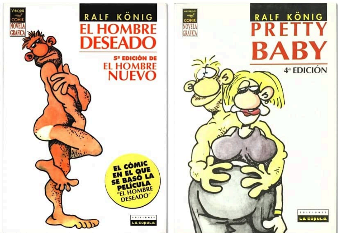
Les cobertes de L'home desitjat i Pretty Baby , totes dues amb el totxo de l'Axel.

Tot això era molt «del col·lectiu» fins a l'arribada de L'home desitjat (1987) i Pretty Baby (1988), quan König es va obrir a crear tots els temes transversals que afectaven tant gais com heteros. Axel, el protagonista de L'home desitjat , és el típic mascle bàsic i masclista que, si entra a la teva vida, la