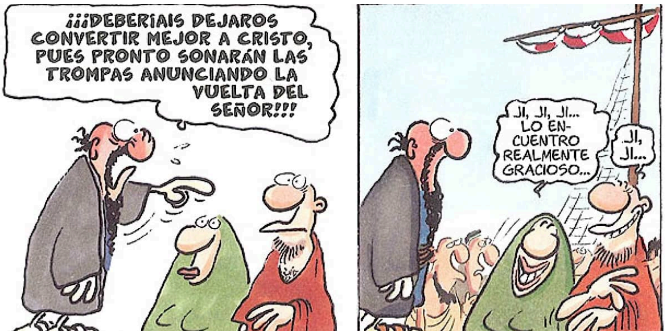
Una escena d'Antitip.

Aborda les històries de l'Antic Testament als sensacionals Prototyp ( Prototipo , 2008) i Arquetyp ( Arquetipo , 2009), també les del Nou Testament a Antityp ( Antitipo , 2010), i s'atreveix fins i tot amb el moviment islamista radical a Dschinn Dschinn. Der Zauber des Schabbar ( Oh, genio! El hechizo de Sabbar , 2005). Hi ha una vinyeta de König sobre un profeta que no posaré aquí — perquè tinc plans i metes a llarg termini a la vida—, però que es pot trobar fàcilment a YouTube.