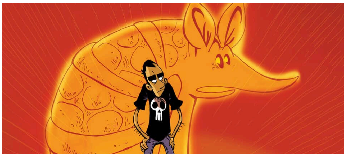
La profecia del armadillo

Zero, el protagonista i alter ego del dibuixant, fa sempre un viatge interior amb punts de vista surrealistes, obscurs, i amb salts estètics entre records, flashbacks i la mateixa invenció o ansietat del personatge, capaç d'imaginar les pitjors situacions del futur. Els personatges que acompanyen el protagonista semblen persones de veritat —de fet, són persones de veritat que l'autor coneix i que ens recorden aquell amic o amiga que hem tingut i a qui hem vist patir, riure i enamorar-se.