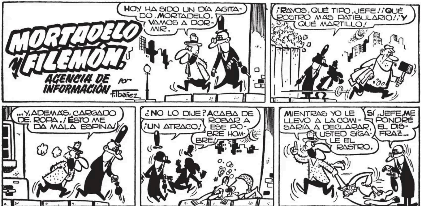
Fragment de la primera historieta publicada de Mortadel·lo i Filemó (1958)

primers personatges que va crear per a la històrica Editorial Bruguera, una parella de detectius incompetents però divertidíssims. Dos personatges anomenats Mortadel·lo i Filemó.