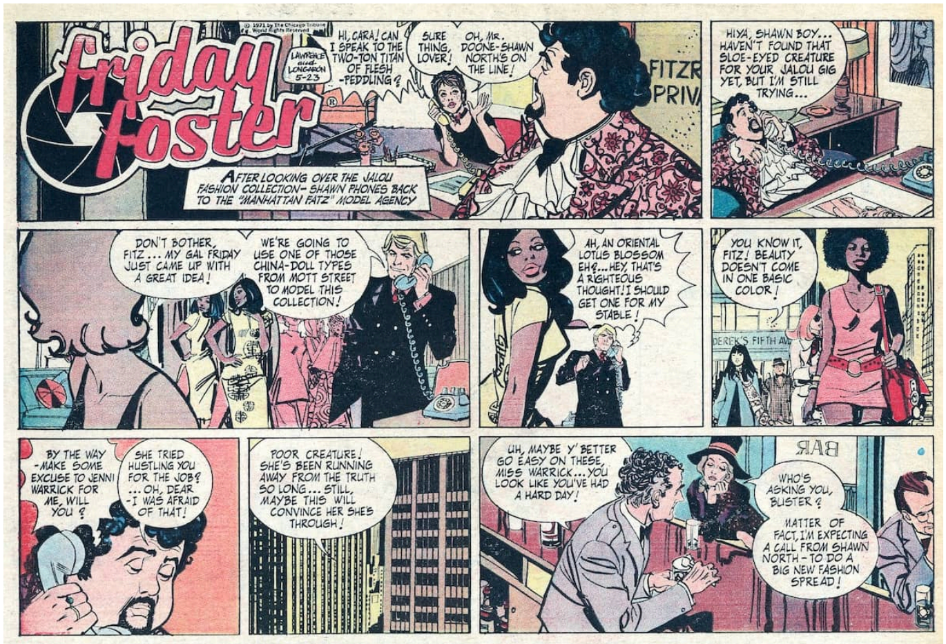
Pàgina de la tira Friday Foster