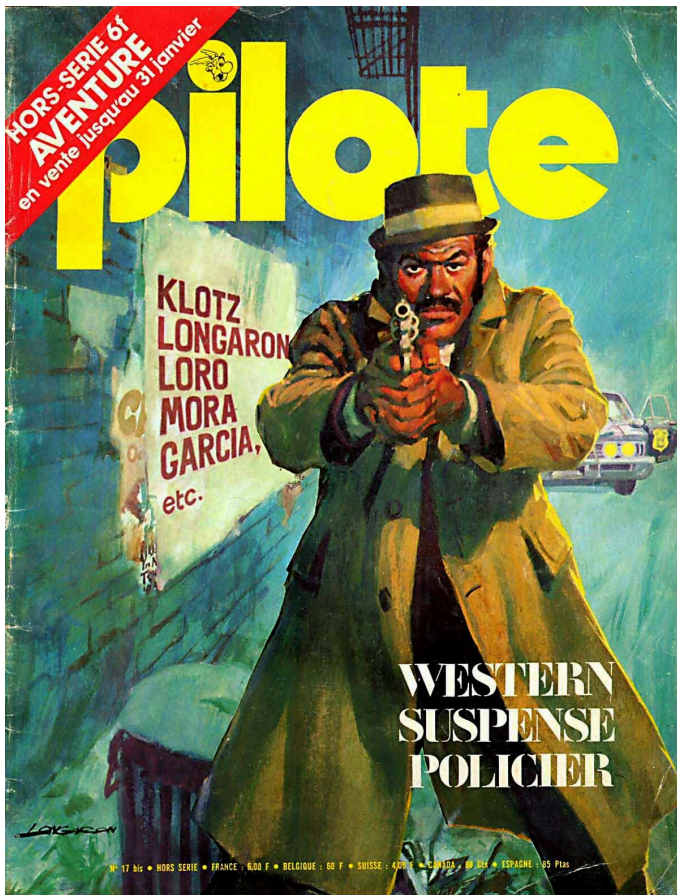
Portada de la revista Pilote n°17