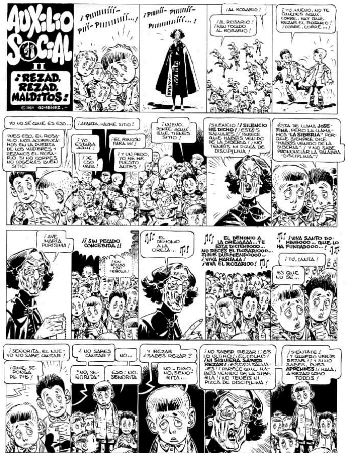
Pàgina de Paracuellos

Ara, a punt de complir-se el mig segle del seu erràtic naixement, Reservoir Books publica la luxosa edició integral d'unes 600 pàgines. Un doble i molt necessari exercici de memòria històrica, cultural i sentimental del nostre país. D'una banda, evidentment, com a document d'enorme valor per entendre la vida i el patiment dels que van ser hostes d'aquelles llars de l'Auxilio Social de postguerra. D'altra banda, aquesta edició ens recorda qui és Carlos Giménez i contribueix a mantenir viu el llegat artístic d'un formidable creador de còmics que, al costat d'alguns dels seus coetanis, va impulsar la modernitat al novè art fet aquí.