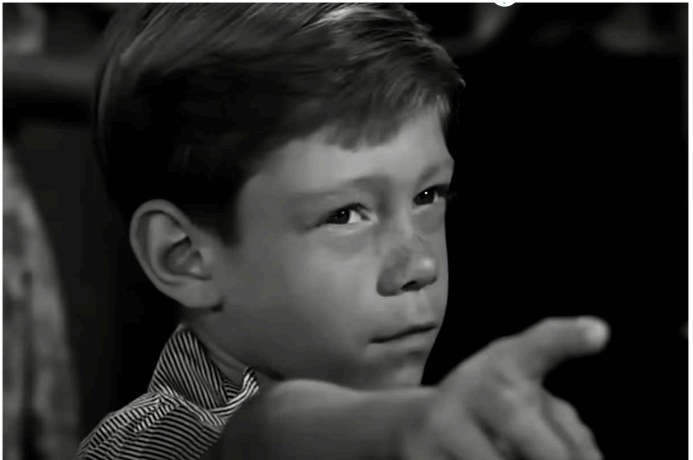
Bill Mummy és l'esfereïdor nen protagonista de La bona vida ( It's a Good Life , 1961).