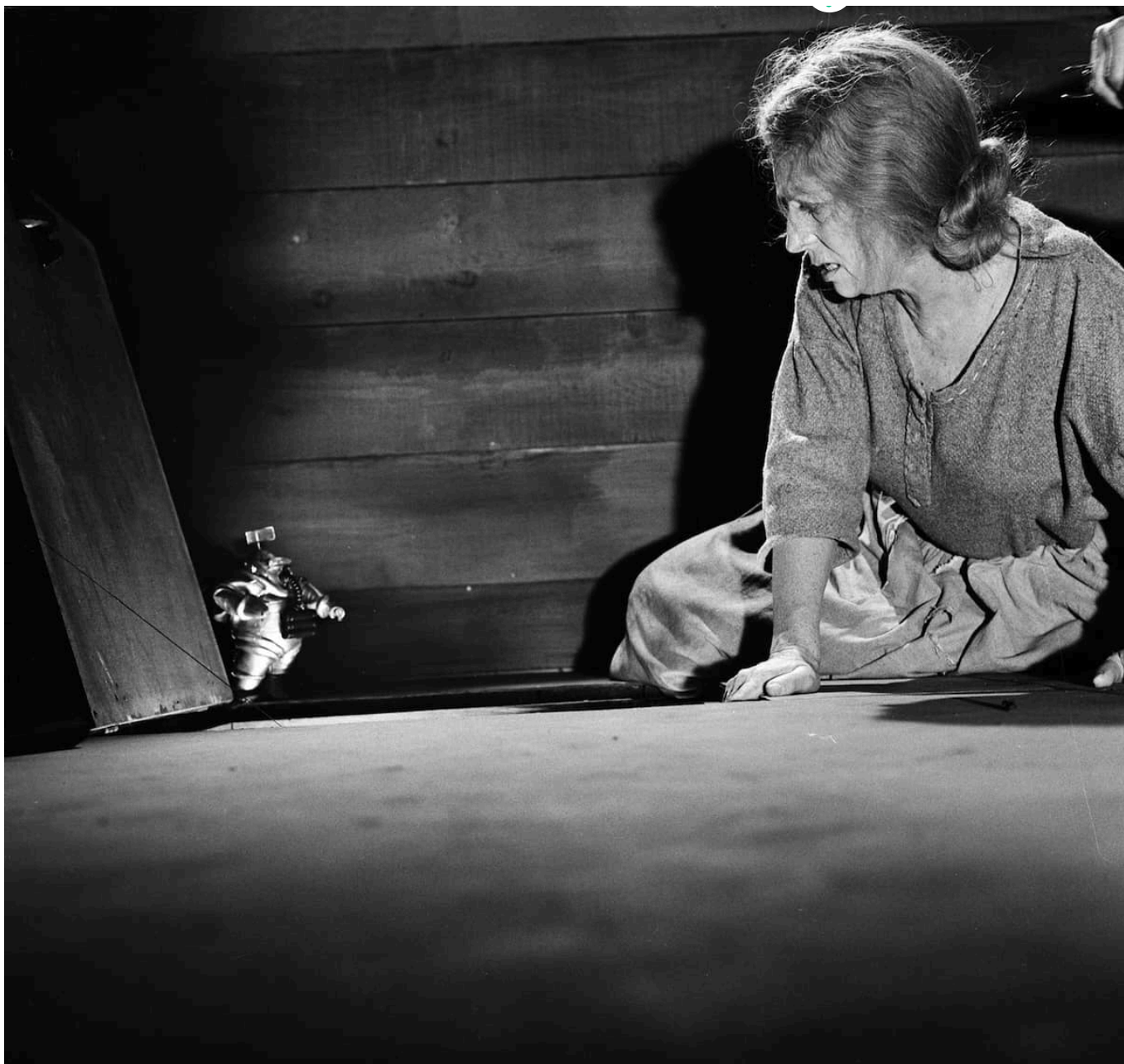
Agnes Moorehead s'enfronta a la curiosa amenaça de l'episodi The Invaders (1961).