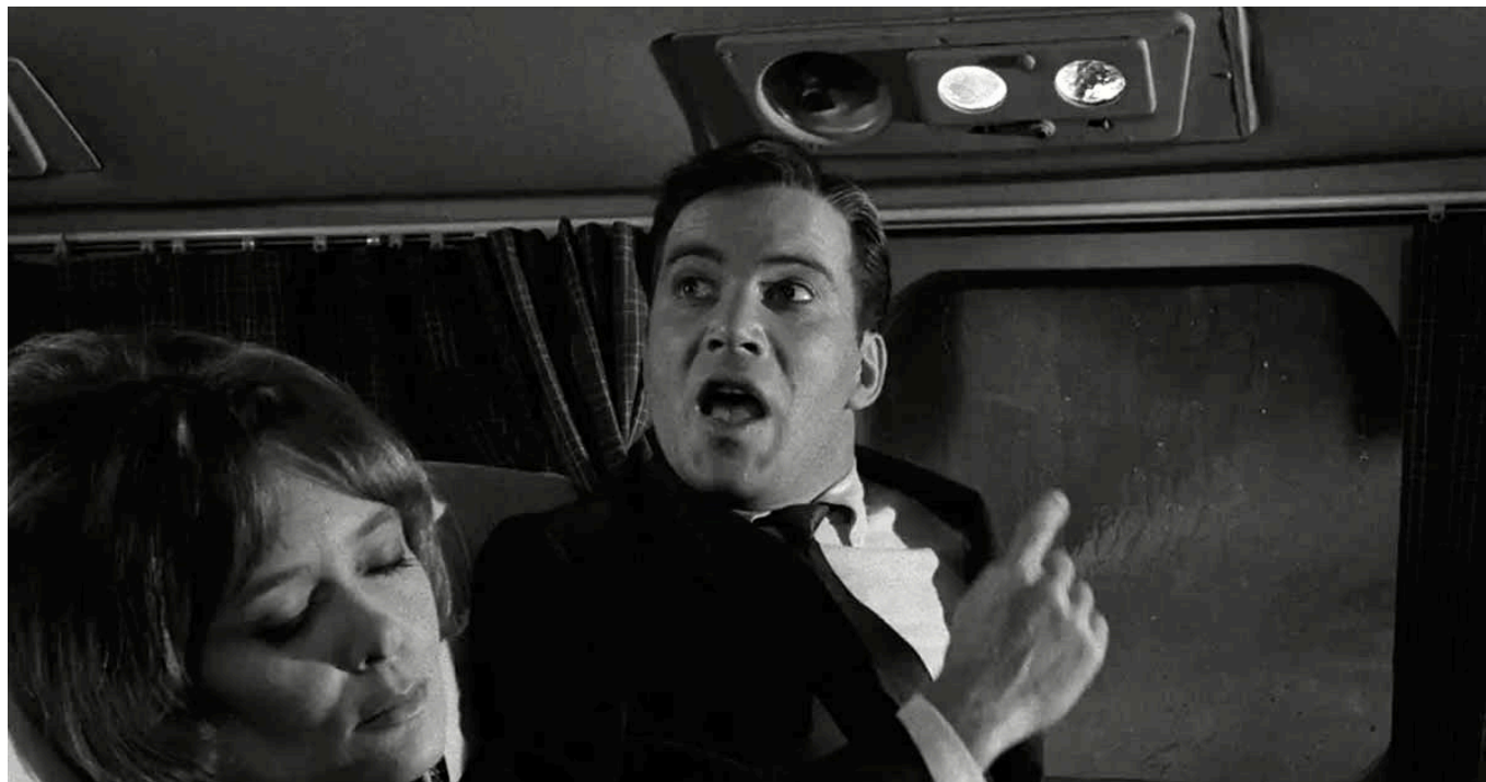
William Shatner al mític capítol Nightmare at 20,000 Feet (1963).

invasors» («The Invaders», 1961), petites grans joies encara avui celebrades tant pel públic com per la crítica, no només per la seva evident qualitat, sinó per haver sabut captar a la perfecció el sentit, l'enfocament i la funció de la proposta de Serling 5 .