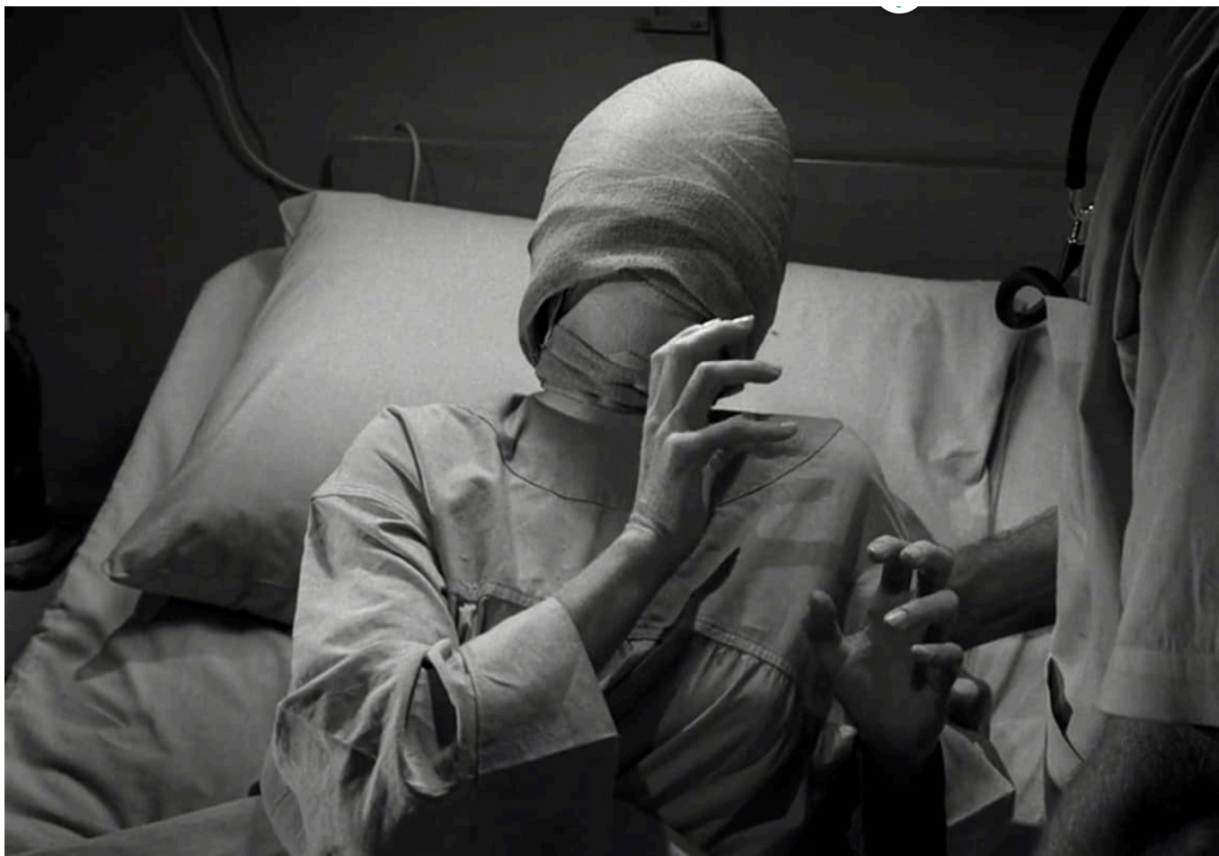
La protagonista de La mirada de l'espectador abans de la gran revelació ( Eye of the Beholder , 1960).