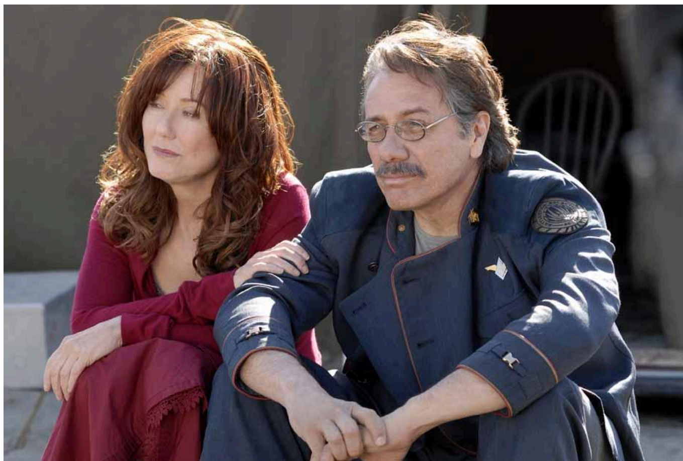
Battlestar Galactica : sensibilitat documental per la space opera.

També si no ens n'arribessin ressons tan interessants d'allà on no era previsible que vinguessin, com d'una producció de Disney per la franquícia de Star Wars: Andor . Però Tony Gilroy, el showrunner de la sèrie, ha tingut l'encert d'aprofitar la bastida d'una de les mitologies audiovisuals més carismàtiques i magnètiques del nostre temps per a dreçar-hi al damunt una reflexió de llarg abast sobre les formes modernes de control i d'enginyeria social i política, els mecanismes de reproducció del poder i la seva moral o la naturalesa i cost de qualsevol dissidència en un món de vigilància panòptica.