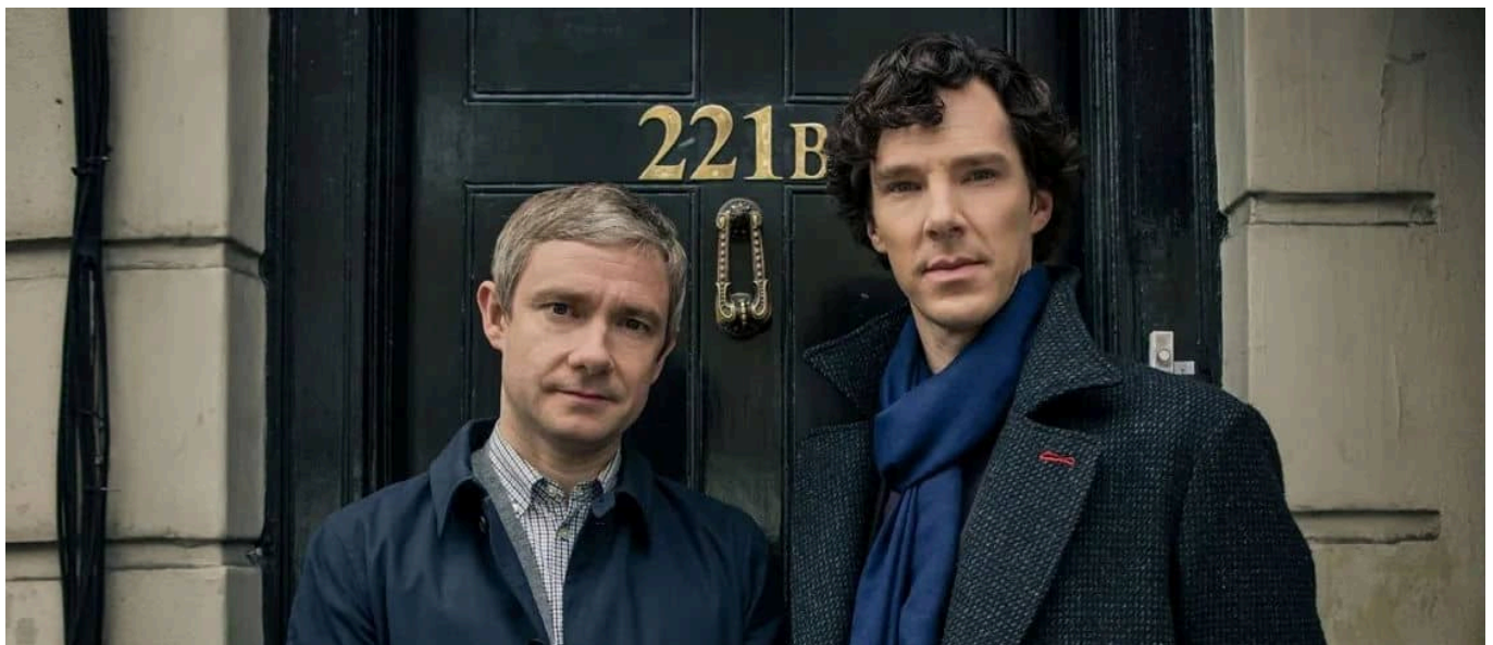
Buffy Vampire Slayer . el coming-of-age de la televisió contemporània

No presenta gaire dificultat sostenir-ho en el primer cas ni és l'objectiu prioritari d'aquestes ratlles. Oferir-ne algunes evidències, però, pot ajudar el lector a revisar les concepcions esbiaixades que hagi pogut assumir sobre el fenomen que amb una mica de pedanteria hem anomenat «l'era daurada de la televisió». Sense anar més lluny, cal recordar que la peça més rellevant d'aquest període d'expansió i revaloració televisiva, el showrunner , és a dir, l'equivalent de l'autor a la petita pantalla, és una figura que apareix i despunta primer en projectes de gènere i sols després es popularitza a les produccions dramàtiques convencionals. Chris Carter i els seus X-Files (1993-2002) o J. Michael Straczynski i Babylon 5 (1993-1998) són dos precursors directes d'aquesta mena de demiürg que controla fortament els ressorts narratius, artístics i fins i tot industrials d'una sèrie i li confereix una intenció, coherència i veu distintives. Tot i així, fou segurament Joss Whedon qui en definí la idiosincràsia amb la seva tasca al capdavant de Buff, the Vampire Slayer (1997-2003); la metamorfosi d'una fantasia teenager de nínxol i pressupost modest en una obra que no sols explora amb agudesia els traumes adolescents i el dolor de créixer, sinó que demostra un gran atreviment en la hibridació de gèneres, l'ús de l'autoreferencialitat i una experimentació amb el llenguatge audiovisual insòlita en una sèrie televisiva juvenil amb vocació més o menys mainstream .