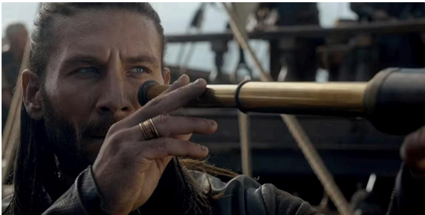
Black Sails : un allargavistes a la farga del món modern i la primera globalització

Com es va comprovar des del primer capítol, el disseny de producció no s'havia estat de res i la factura del producte era impecablement cinematogràfica. Uns elements que, sumats a la presència de Michael Bay com a productor executiu —que tot i no tenir cap intervenció en l'apartat artístic, suggeria l'espectacularitat rotunda però buida dels seus films— i al precedent de referència del gènere que era la saga de Pirates del Carib , predisposaven a esperar un producte tan amè de veure com superficial a l'hora de dibuixar el retrat de la fascinadora classe d'inadaptats i marginats que alimentaren el fenomen de la pirateria o de les tèrboles condicions materials i polítiques que el feren possible.