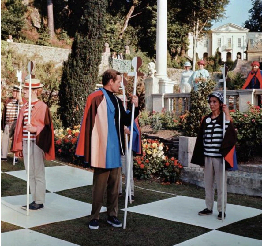
Joc d'escacs humans al centre del Village.

«El 1967, aquest actor lloat pel mateix Orson Welles va decidir baixar de l'èxit televisiu "fàcil" per a idear un heterodox artefacte serial titulat The Prisoner , antecessor de fites de la postmodernitat com Twin Peaks o Lost », explica Enric Ros en un article sobre la sèrie que ens ocupa, publicat a la web Serializedos .