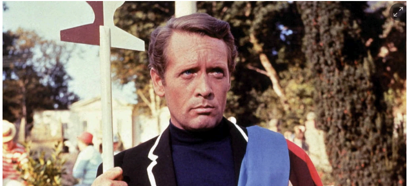
Logotip de The Prisoner de Berthold Wolpe, amb la tipografia Albertus.

Un tro que anticipa la tempesta imminent. Una carretera i, de fons, trompetes i un bongo. Un Lotus Seven recurrent-la a tota velocitat. La música de Don Grainer arrenca del tot. Primer pla del conductor: cara seriosa, com de revenja, com dient «ara veureu». El vehicle entra en el centre de Londres i baixa per un túnel. El següent que veiem és el conductor caminant, tibet, sever, roba fosca, pel soterrani d'algun ombrívol departament governamental. Mateixa cara d'abans. Entra en un despatx i hi munta un sacramental. Crits, papers tirats, amenaces i cop de porta final. El nostre protagonista torna a estar en el seu Lotus, surt d'allà i se'n va cap a casa seva. Hi arriba i s'apresta a omplir una maleta, fotrà el camp ben lluny. Mentrestant, en un altre lloc, un robot agafa la seva fotografia i la tatxa. Una X gegant sobre el seu rostre. Aquest ja no és dels nostres. No sabem el seu nom, però entenem que és un agent secret, algú amb molta informació molt delicada. Al mateix temps, un home amb levita i barret de copa se situa davant de la casa del nostre protagonista i hi allibera, a través del pany, un potent gas narcòtic. Tot comença a donar voltes dins del cap de l'home del Lotus, fins que s'esvaeix. La seva vida, tal com la coneixia, s'acaba d'acabar.