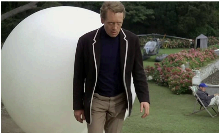
El Número 6 escortat per un dels guardians esfèrics del Village. En el seu rostre, la

Després de la seva estrena en la televisió canadencan el 5 de setembre, el primer episodi de The Prisoner es va emetre a la ITV per a la Gran Bretanya el 29 de setembre de 1967. Començava el xou. Començava el kafkià joc del gat i el ratolí entre el Número 6, que posa en pràctica noves i imaginatives maneres per intentar fugir d'aquell Village (els exteriors de la sèrie es van rodar a Portmeirion, un deliciós enclavament turístic gal·lès) on mai s'acaba de saber qui són els presoners i qui els guardians, i uns captors que volien doblegar-ho utilitzant tota mena d'astúcies i manipulacions. Des de ficar-se en els seus somnis per alterar-los, fins a construir un duplicat d'ell mateix per trencar-li el sentit de la identitat, passant per aïllar-lo socialment.