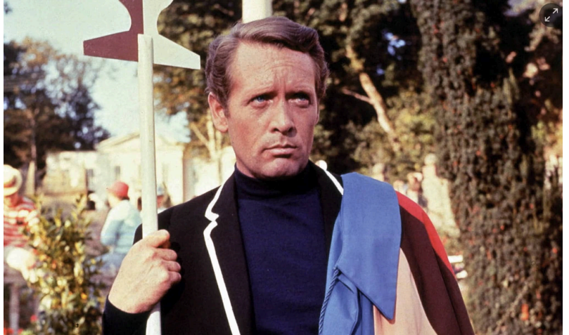
El Número 6 com a peó

Nascut a Nova York i educat a Irlanda, Patrick Joseph McGoohan es va ficar en el món de la interpretació gairebé per casualitat, el dia en què, sent ell tramoista al Sheffield Repertory Theatre, va substituir un actor que s'havia posat malalt. Era el 1954 i a partir d'aquell moment no va haver-hi marxa enrere. Es dedicaria a la interpretació.