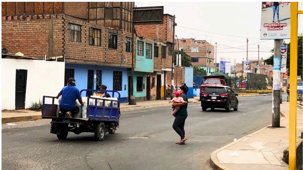
Figura 2. El binomio enfrentando un cruce vehicular en Cercado de Lima.

La ciudad se convierte en un entramado de obstáculos y decisiones para el binomio: desde escaleras imposibles de transitar con un coche o en brazos hasta la necesidad de cruzar avenidas sin semáforos o sortear mototaxis y autos en zonas sin veredas. Esta experiencia exige una lectura sensorial del espacio: olores, texturas, temperaturas, sonidos. Y todo ello mientras se regulan el hambre, el sueño, el miedo o la curiosidad de la niñez, y la ansiedad o el cansancio de la persona adulta. Se trata de cuerpos que sostienen a otros cuerpos, y que al caminar dejan al tiempo huellas afectivas, reclamos de ciudad, marcas de cuidado sobre el territorio traducidas en rutas (Jirón, 2014).