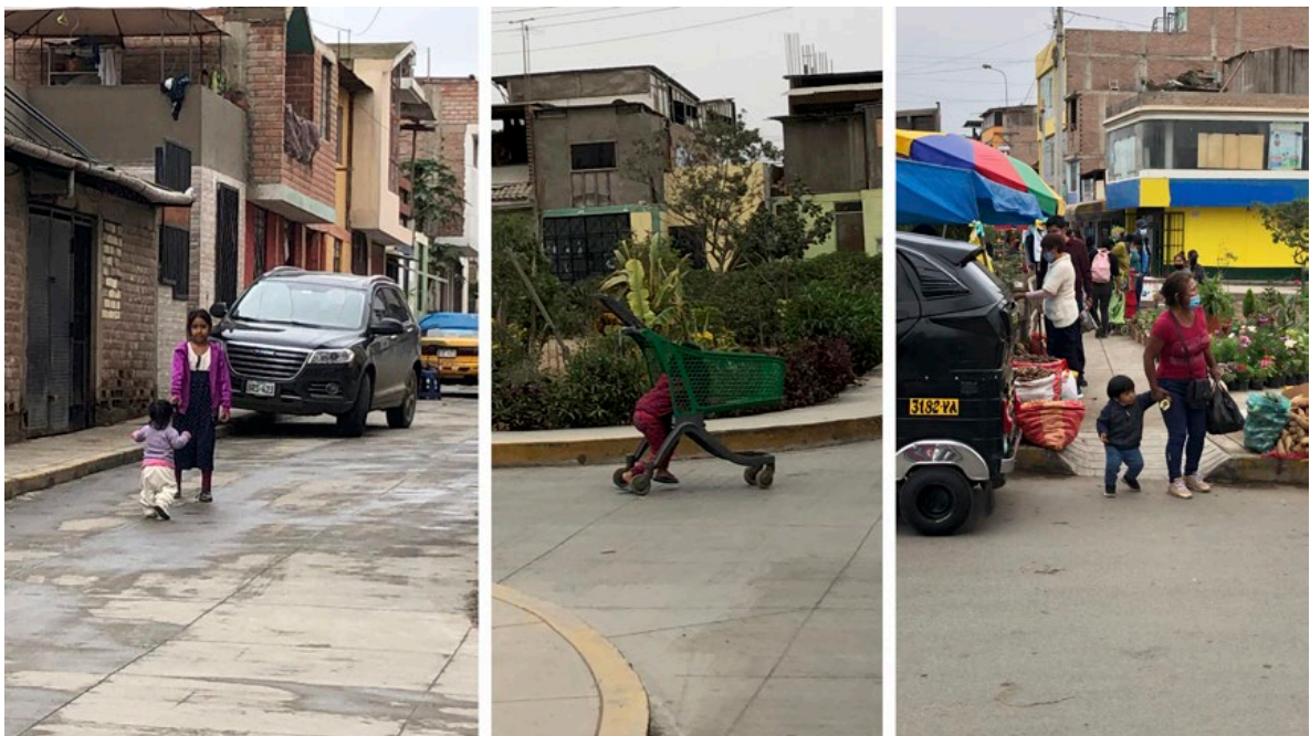
Figura 3. Infancia exploradora en Villa el Salvador.

La movilidad cotidiana, vista desde el binomio, se revela como una dimensión política. No solo por el acceso desigual a la infraestructura y los servicios, sino porque implica disputar el derecho al espacio público desde una corporalidad que cuida y que necesita ser cuidada. La cuidadora no solo camina: sostiene bolsas, mochilas, cuerpos; regula emociones, anticipa necesidades y responde al entorno. La infancia no solo es llevada: observa, pregunta, se detiene, explora, se aburre, se emociona. Este entramado de interacciones construye un modo singular de transitar la ciudad, profundamente cargado de significados.