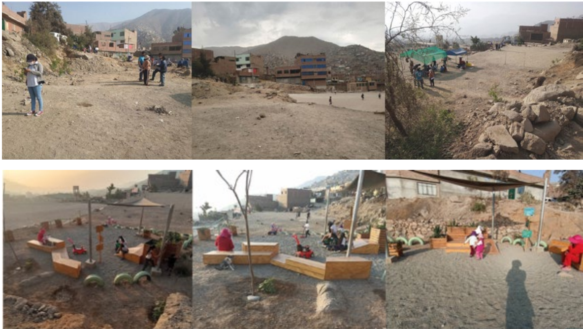
Figura 13. Antes -Arriba- y después -Abajo- en Huaycan.

palanca; es capaz de abrir una grieta insignificante que se cruza y entrelaza con otras tantas insignificancias” (p. 38).