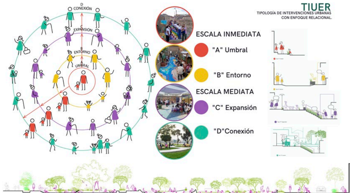
Figura 9. TIUER como lente relacional del territorio resiliente. Fuente: Anidare (2023).

Las rutas de cuidado como territorios de... A. N. LOYOLA RAMÍREZ Y P. QUEVEDO CASTAÑEDA