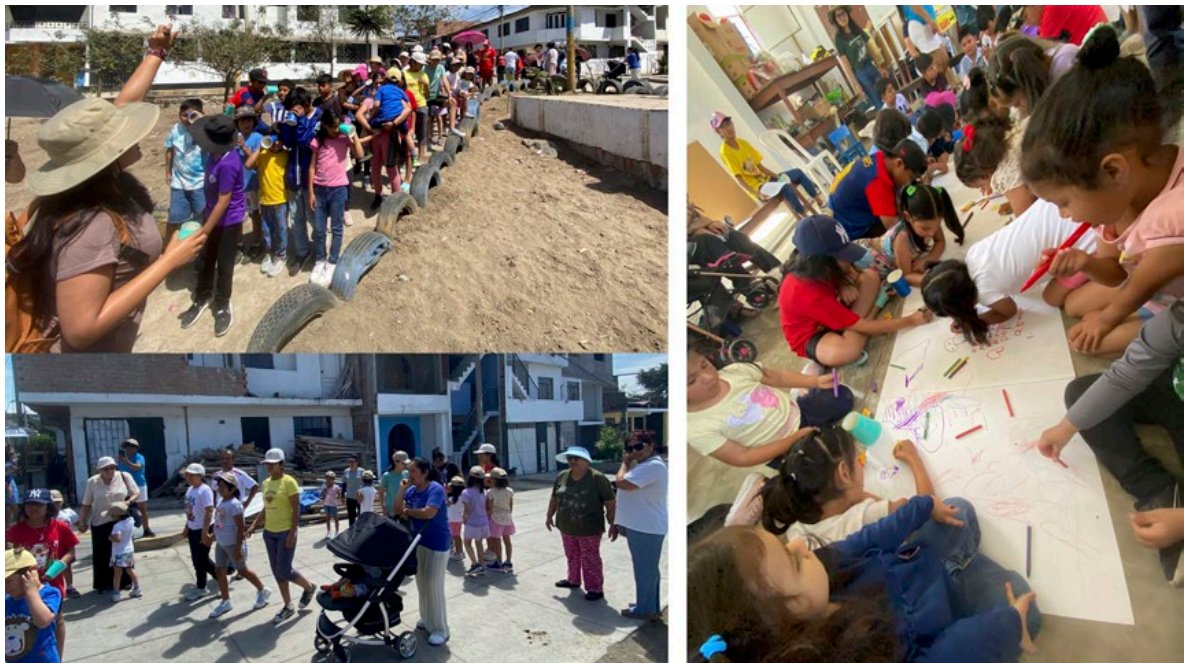
Figura 6. Marcha exploratoria en Villa el Salvador con el binomio para re—conocer nuestro entorno y pasar del placer del hacer a pensar y codiseñar nuestro parque ideal.

Por eso, hablar de rutas de cuidado implica ir más allá del diseño urbano tradicional: se trata de reconocer el valor epistémico del trayecto como constructor de mundo. Las caminatas cuidadoras no solo permiten el desplazamiento del cuerpo, sino también la expansión del pensamiento, la emoción y el lenguaje. Son rutas que enseñan a mirar, a nombrar, a imaginar, a cuidar.