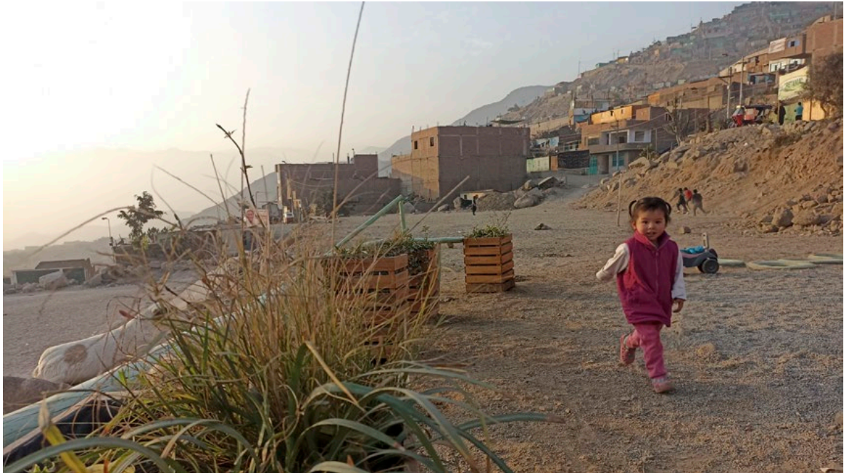
Figura 11. Accesibilidad autónoma gracias a la implementación de vegetación como límite y la implementación de barandas doble nivel. Huaycan.

Las rutas de cuidado como territorios de... A. N. LOYOLA RAMÍREZ Y P. QUEVEDO CASTAÑEDA