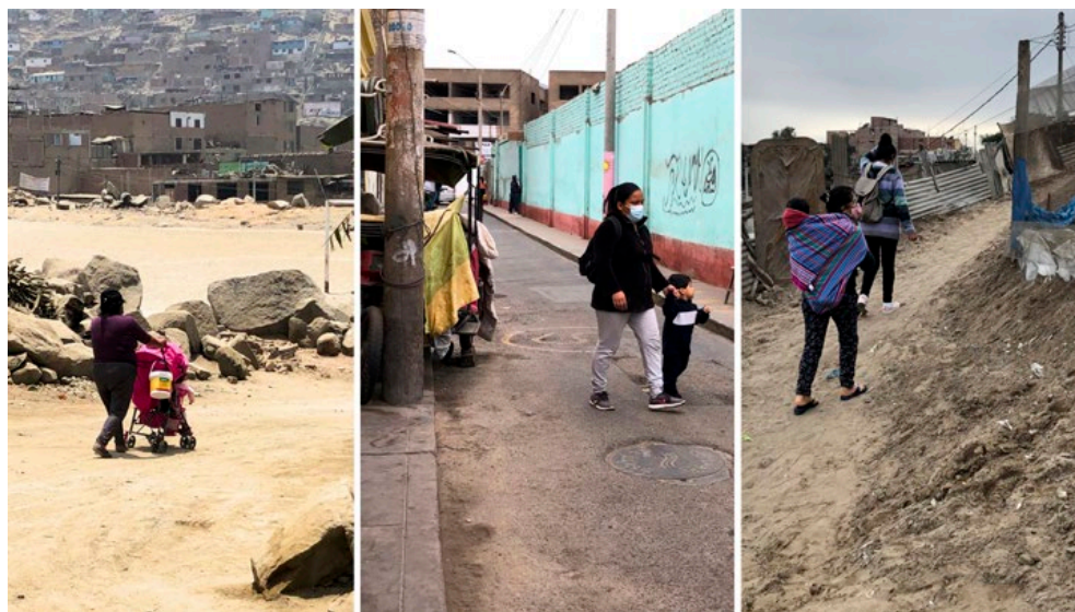
Figura 1. Experiencia de la caminata del binomio cuidador(a)-infancia en Huaycan, Ate; Jirón Coata, Cercado de Lima y El mirador, San Juan de Miraflores.

Así, el binomio cuidador(a)-infancia no solo representa una relación afectiva, sino también una unidad móvil de cuidado que revela las tensiones entre el diseño urbano y las necesidades reales del desarrollo infantil y del trabajo de cuidado en la ciudad.