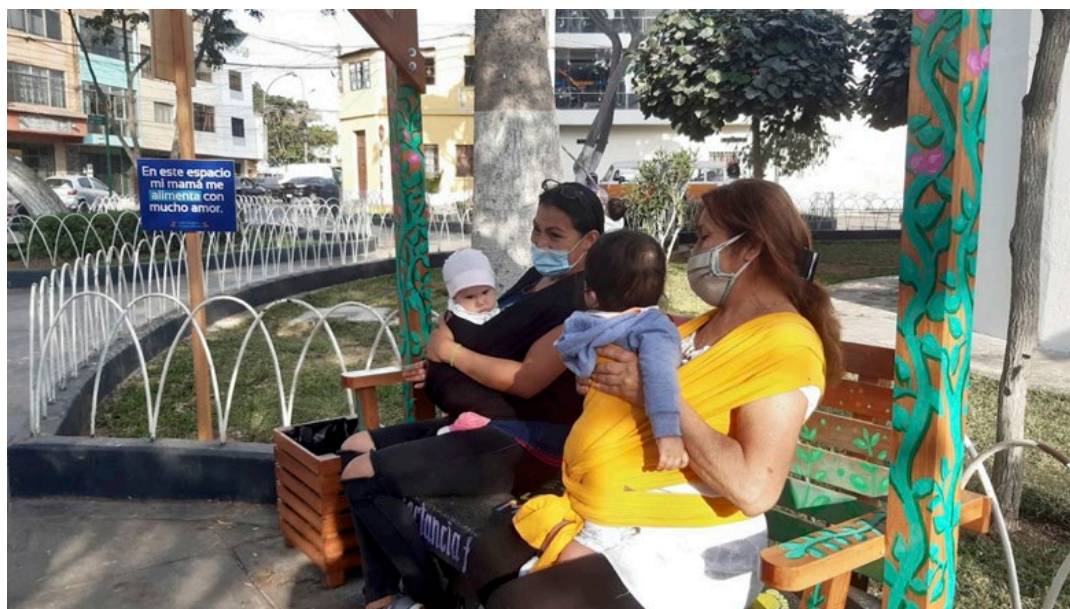
Figura 10. Bancas de lactancia en mercado de Lima: acondicionamientos en el espacio público con enfoque de desarrollo infantil temprano LAB95 - Municipalidad de Lima.

Las condiciones en que se disponen las rutas no son neutras ni universales: dependen de las múltiples intersecciones de género, edad, condición migratoria, etnia, educación y situación socioeconómica. En territorios donde el binomio está expuesto a múltiples formas de exclusión, el diseño de rutas de cuidado debe ser una herramienta de justicia espacial. Esto implica territorializar el cuidado: leer el espacio desde sus vínculos, sus umbrales, sus silencios y sus resistencias.