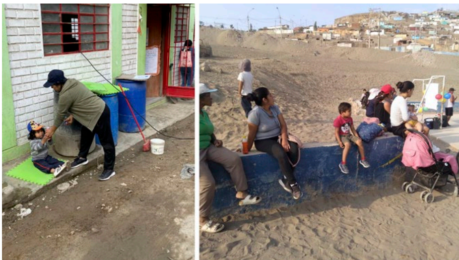
Figura 4. Tácticas de ocupación del Binomio: alimentación y contemplación.

Frente a este entorno adverso, el binomio despliega un conjunto de estrategias micro-políticas que resignifican el espacio urbano desde el cuerpo que cuida (Díaz, 2023). Por ejemplo, las paradas improvisadas en gradas, veredas anchas, entradas de negocios o incluso muros bajos se convierten en bancos, lugares de descanso o espacios de alimentación. Estas adaptaciones no están previstas por la infraestructura, pero surgen como formas creativas de reclamar espacio para sostener el cuidado (Anidare Company, 2023). Como señala De Certeau (2000), la táctica es propia de quien no tiene lugar propio: el binomio camina tácticamente, apropiándose momentáneamente del espacio ajeno, en una ciudad que no fue diseñada para sostenerlo.