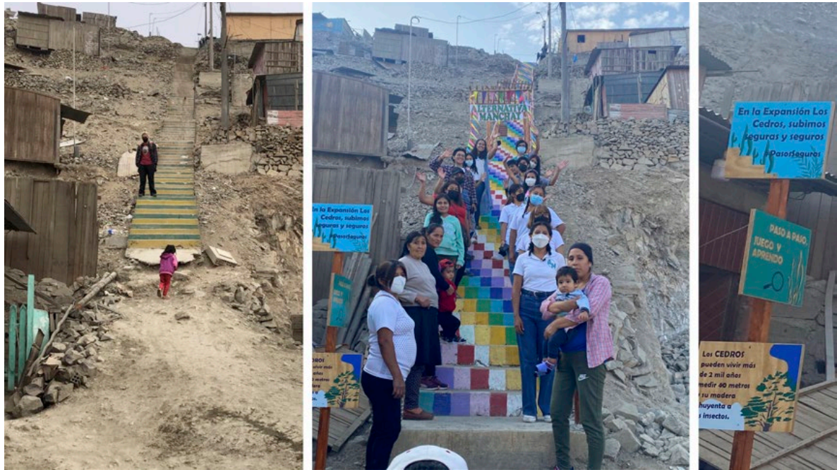
Figura 7. Pasos seguros en Manchay Pachacamac. Antes y después de la intervención.

Estos testimonios evidencian cómo mejoras tácticas en la infraestructura pueden transformar la experiencia urbana del cuidado, favoreciendo la seguridad, la autonomía y la corresponsabilidad vecinal.