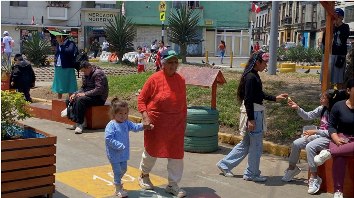
Figura 14. Abuela cuidadora con su vestimenta de trabajo en restaurante, caminando en entorno escolar Moqueuwawa a la salida del colegio.

Estos testimonios, en conjunto, evidencian que la apropiación comunitaria del espacio urbano no solo mejora la seguridad y la movilidad, sino que también reconstruye vínculos sociales y afectivos, fortaleciendo el tejido cotidiano del cuidado.