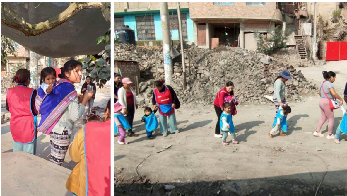
Figura 5. Salida con sentido, ruta segura de la cuna a la plaza/ paradero en El Mirador, San Juan de Miraflores.

Las rutas de cuidado, por tanto, no solo materializan infraestructuras físicas, sino que producen territorio emocional: condensan las interacciones, los afectos y las rutinas que articulan comunidad y espacio, transformando la experiencia urbana en una red de relaciones sensibles que desafían la aparente neutralidad del paisaje.