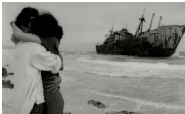
Imagen 4. Fotograma de la película.