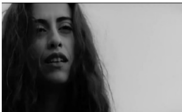
Imagen 2. Fotograma de la película.

Asimismo, tenemos los primeros planos de Alex en la historia enmarcada, de forma paralela a lo que está sucediendo en la historia marco con la madre de Paco. Así, son importantes los primeros planos de Alex en el instante en el cual ella se rebela contra el dueño del restaurante donde trabaja en Lisboa. Estos primeros planos ponen en evidencia los sentimientos de impotencia e indignación que sufre Alex ante los atropellos de su jefe. Además de estos primeros planos de Alex son interesantes aquellos que ocurren en el momento en el que ella se encuentra con Miguel, la pareja con la cual se desplazó a Lisboa. Los primeros planos de Alex en estas escenas de la narración, rasgan el velo de su mundo interior, para poner de manifiesto el inquietante temor que experimenta en Lisboa: una ciudad bonita y grande, pero en la cual cada día se acentúa su condición de extranjera.