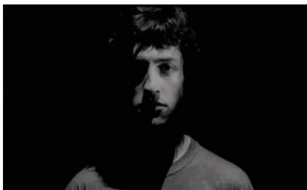
Imagen 3. Fotograma de la película.

Por otro lado, podemos distinguir como marca enunciativa la representación de una parte del cuerpo en primer plano, cuando la cámara nos muestra su anclaje en una mirada, a través de imágenes que aparecen afectadas por cierta deformación o distorsión, con lo que juzgamos una visión “normal”. Son evidentes los primeros planos de las partes iluminadas y oscuras del rostro de Paco, cuando asiste a la prueba en la cual evaluarán su declamación del poema que ha estado ensayando por mucho tiempo.