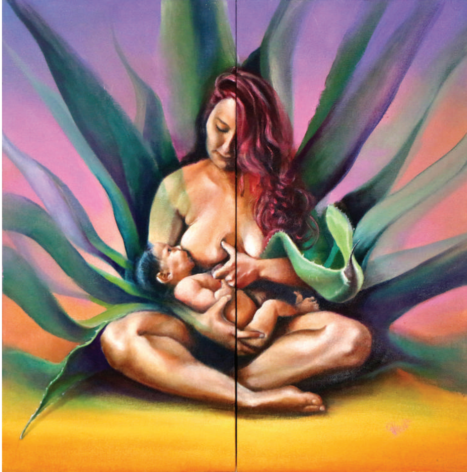
Amamantando Mayahuel (2021). Técnica mixta: Ulises Gutiérrez-Bonilla Prohibida su reproducción en obras derivadas.