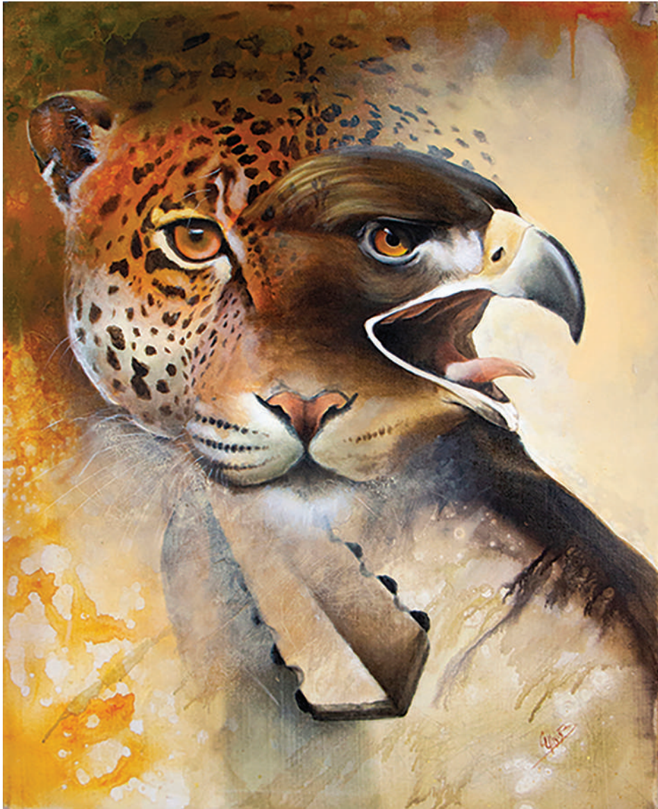
Águila Jaguar y vida Xochiyaoyotl (2022). Técnica mixta: Ulises Gutiérrez-Bonilla Prohibida su reproducción en obras derivadas.