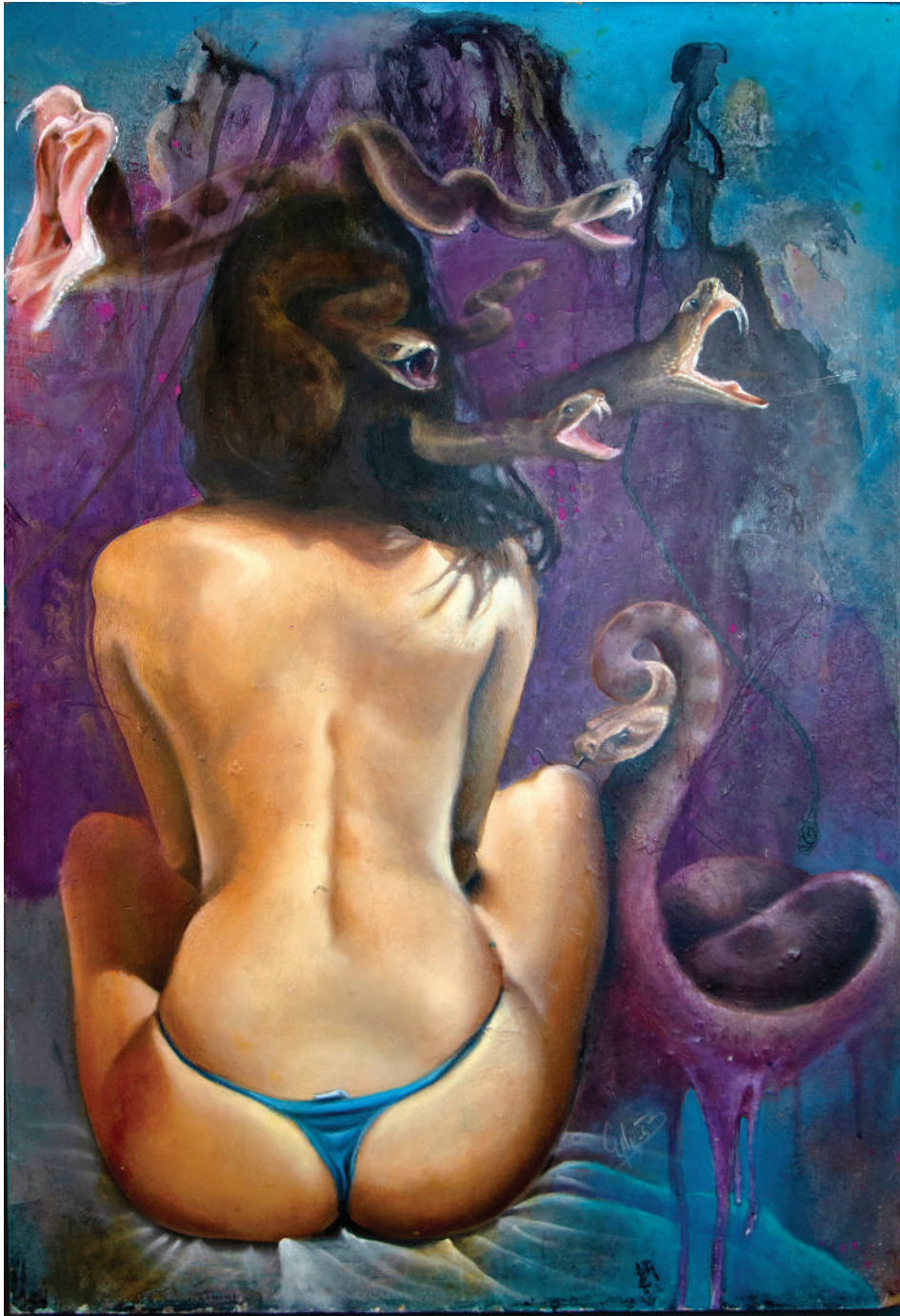
Esténo hambrienta (2020). Técnica mixta: Ulises Gutiérrez-Bonilla Prohibida su reproducción en obras derivadas.