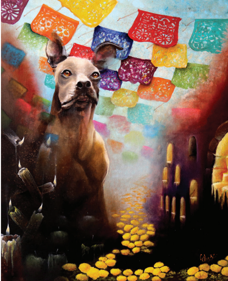
Camino al Mictlan (2023). Técnica mixta: Ulises Gutiérrez-Bonilla Prohibida su reproducción en obras derivadas.