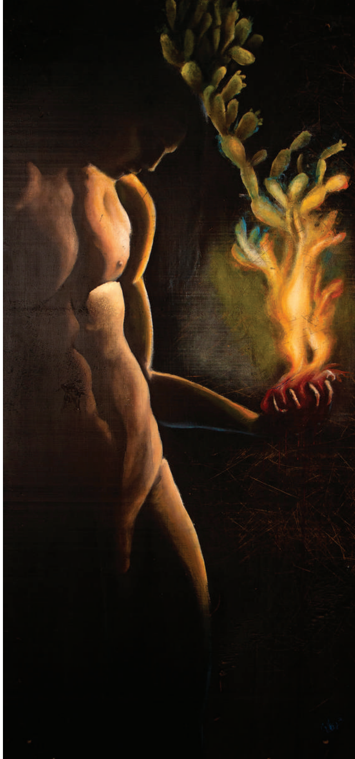
Sangrado corazón de Copil (2017). Técnica mixta: Ulises Gutiérrez-Bonilla Prohibida su reproducción en obras derivadas.