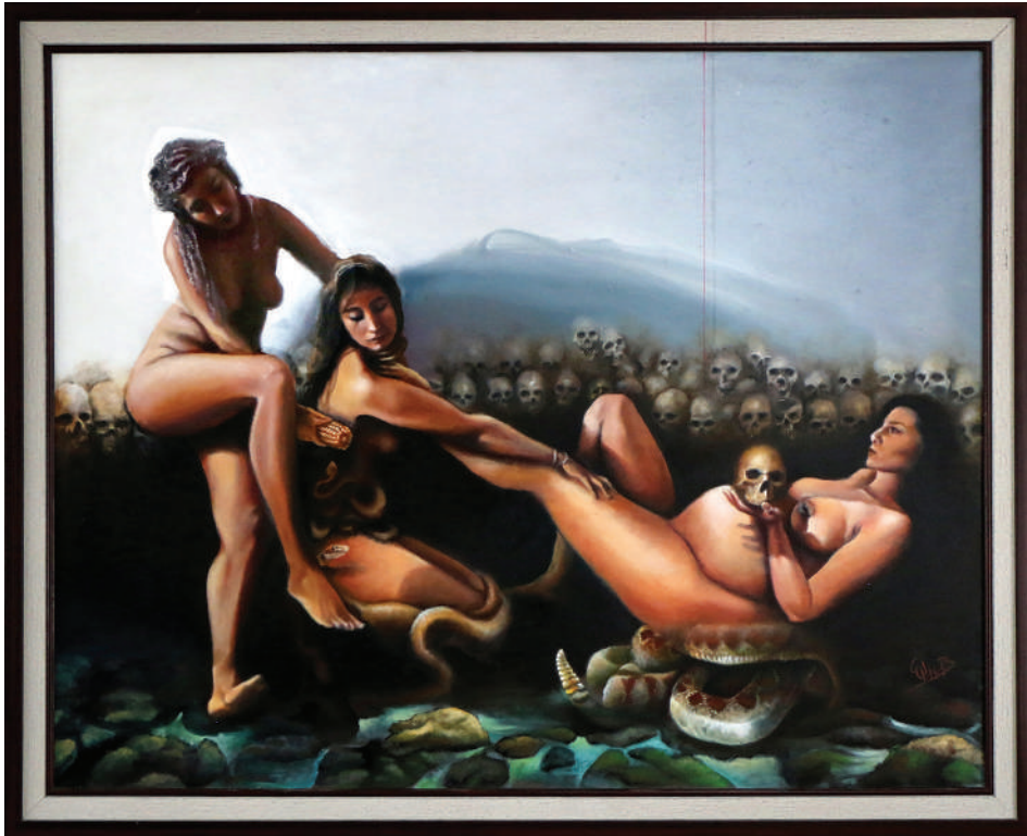
Chicomecóatl, Coatlicue, Cihuacóatl y Tzompantli (2021). Técnica mixta: Ulises Gutiérrez-Bonilla Prohibida su reproducción en obras derivadas.