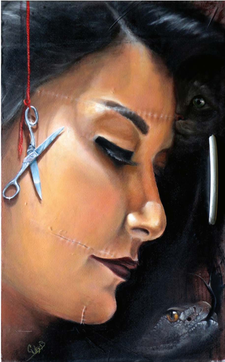
La voracidad del pensamiento (2019). Técnica mixta: Ulises Gutiérrez-Bonilla Prohibida su reproducción en obras derivadas.