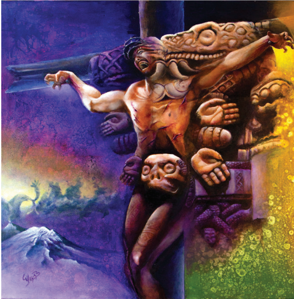
Mestizaje espiritual (2022). Técnica mixta: Ulises Gutiérrez-Bonilla Prohibida su reproducción en obras derivadas.