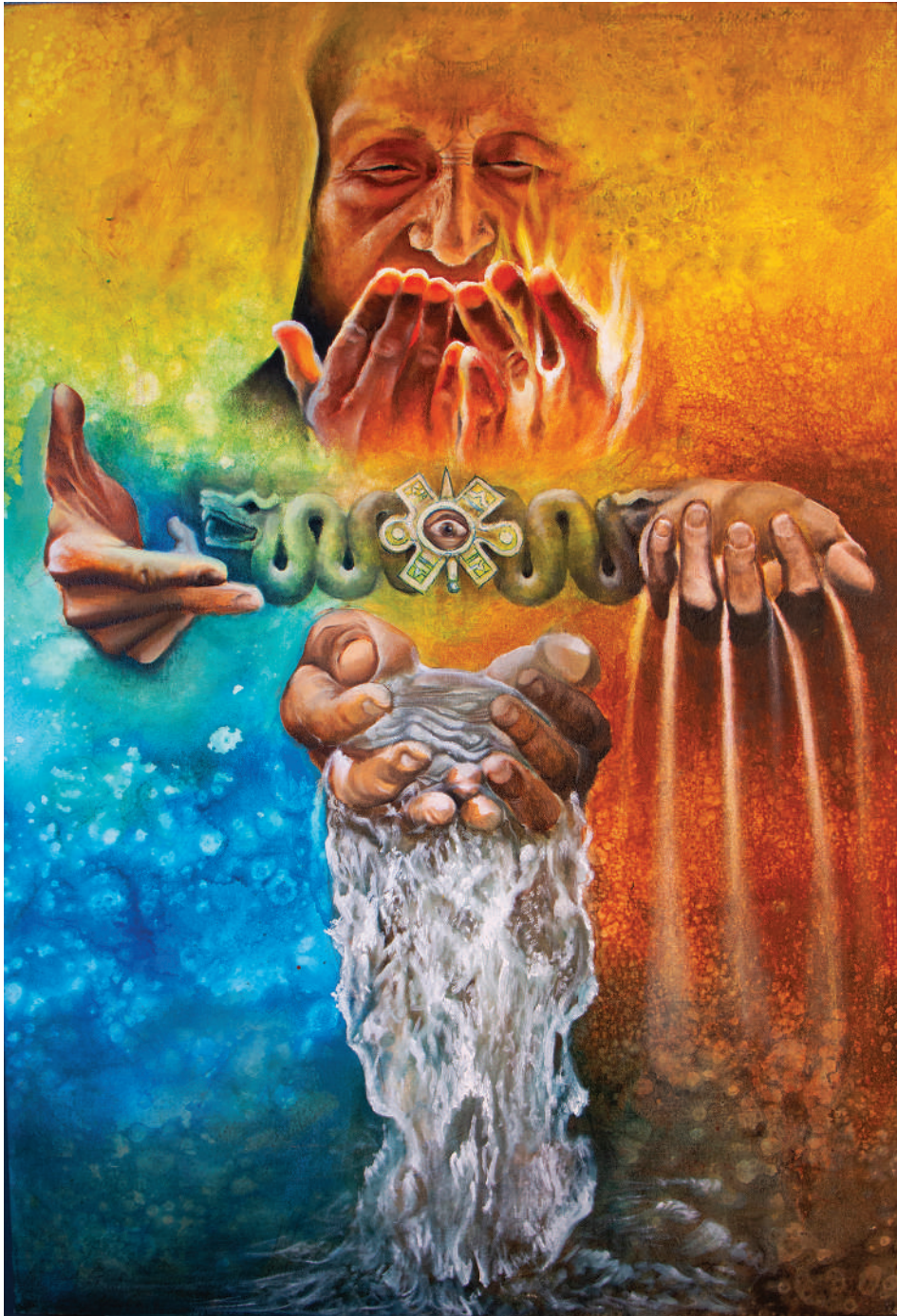
Los 4 Rumbos TLETL EHECATL TLALLI ATL (2023). Técnica mixta: Ulises Gutiérrez-Bonilla Prohibida su reproducción en obras derivadas.