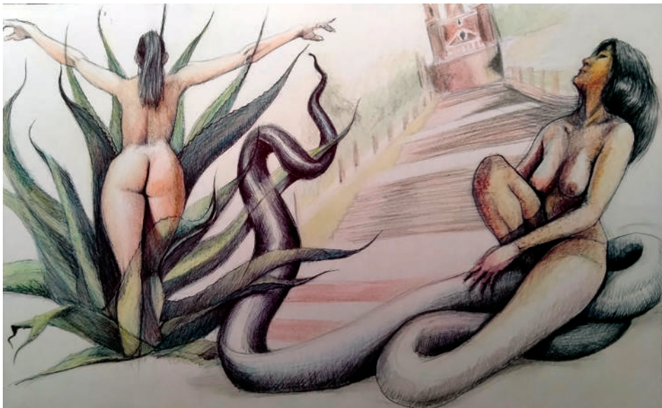
Boceto Mayahuel y Tlamchana (2019). Técnica bolígrafo: Ulises Gutiérrez-Bonilla Prohibida su reproducción en obras derivadas.