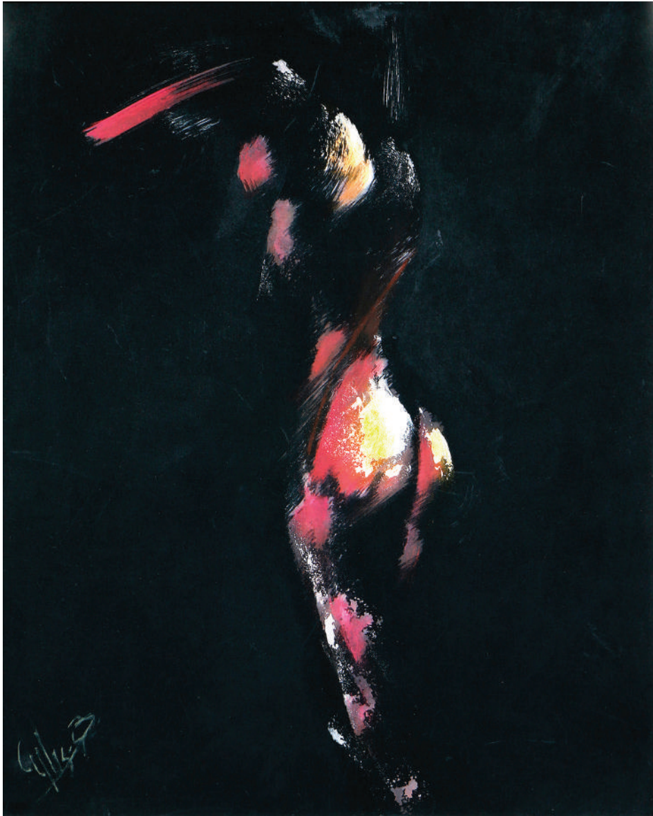
Hemos (2017). Técnica mixta: Ulises Gutiérrez-Bonilla Prohibida su reproducción en obras derivadas.