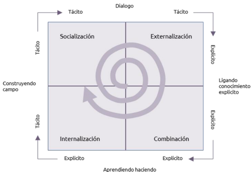
Gráfico 2: Espiral Creación del Conocimiento (Modelo SECI)