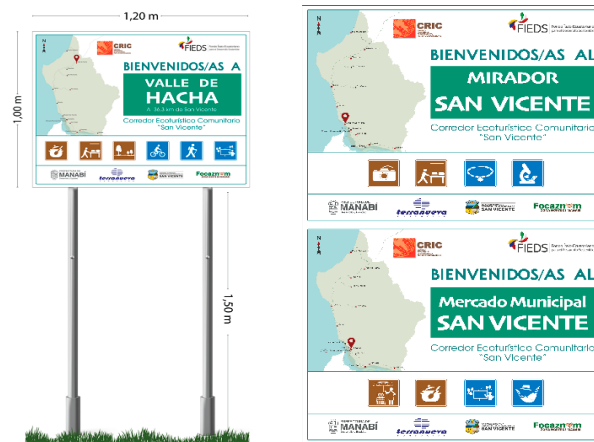
Ilustración 3. Ballas publicitarias

El trabajo se llevó a cabo utilizando dos tipos diferentes prototipos de letreros: uno para los 15 puntos ecoturísticos significativos y otro para la configuración general del Corredor EC-SV. Este último tiene un tipo diferente de material de soporte, ya que se optó por utilizar la madera para mimetizarse con el entorno que lo rodea.