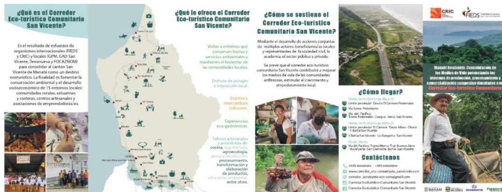
Ilustración 4. Tríptico informativo de Corredor EC-SV

Los trípticos incluyen información clave sobre el Corredor EC-SV, como su propósito, modo de operación, direcciones de ruta al destino, información de contacto y un mapa con pictogramas de posibles atracciones y actividades según los puntos de visita.