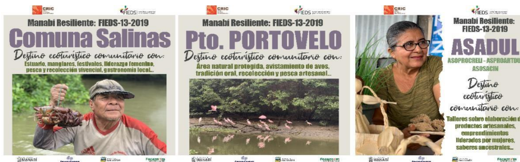
Ilustración 5. Material publicitario para el Corredor Ecoturístico Comunitario San Vicente

El contenido publicitario para el Corredor EC-SV resume las atracciones, actividades, productos, servicios y oportunidades locales potenciales de 15 sitios de ecoturismo. Además, se adjunta una fotografía que captura la naturaleza de los actores locales y las características naturales de cada lugar, a continuación, se presentan unos ejemplos de lo realizado.