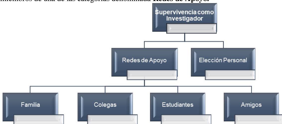
Figura 2: Referentes que conforman las categorías que emergieron de la interrogante: supervivencia como investigador

Para sobrevivir, o para seguir viviendo como investigadores, como lo afirma I 6 , los informantes han hecho uso de sus recursos internos y externos con el propósito firme de no sucumbir ante los obstáculos ya descritos en las secciones precedentes. De esta interrogante surgieron dos (2) categorías (ver Figura 2), donde se destaca a la familia como uno de los miembros de una de las categorías denominada Redes de Apoyo .