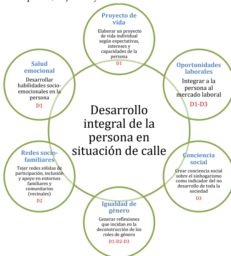
Figura 3. Aspectos, objetivos y dimensiones del modelo tridimensional.

El objetivo principal de intervención de este modelo es el desarrollo integral de la persona que está en situación de calle. Para ello, y de acuerdo a los aspectos que se pretenden abordar y que desde esta propuesta son básicos para que el objetivo principal se cumpla, se han delineado seis objetivos particulares: 1) elaborar un proyecto de vida individual de acuerdo a las expectativas, intereses y capacidades de la persona; 2) integrar a la persona al mercado laboral; 3) desarrollar habilidades socio-emocionales en la persona; 4) tejer redes sólidas de participación, inclusión y apoyo en los entornos familiares y comunitarios (vecinales); 5) generar reflexiones que incidan en la deconstrucción de los roles de género y en la igualdad de género; 6) crear conciencia social sobre el sinhogarismo como indicador del no desarrollo de toda la sociedad.