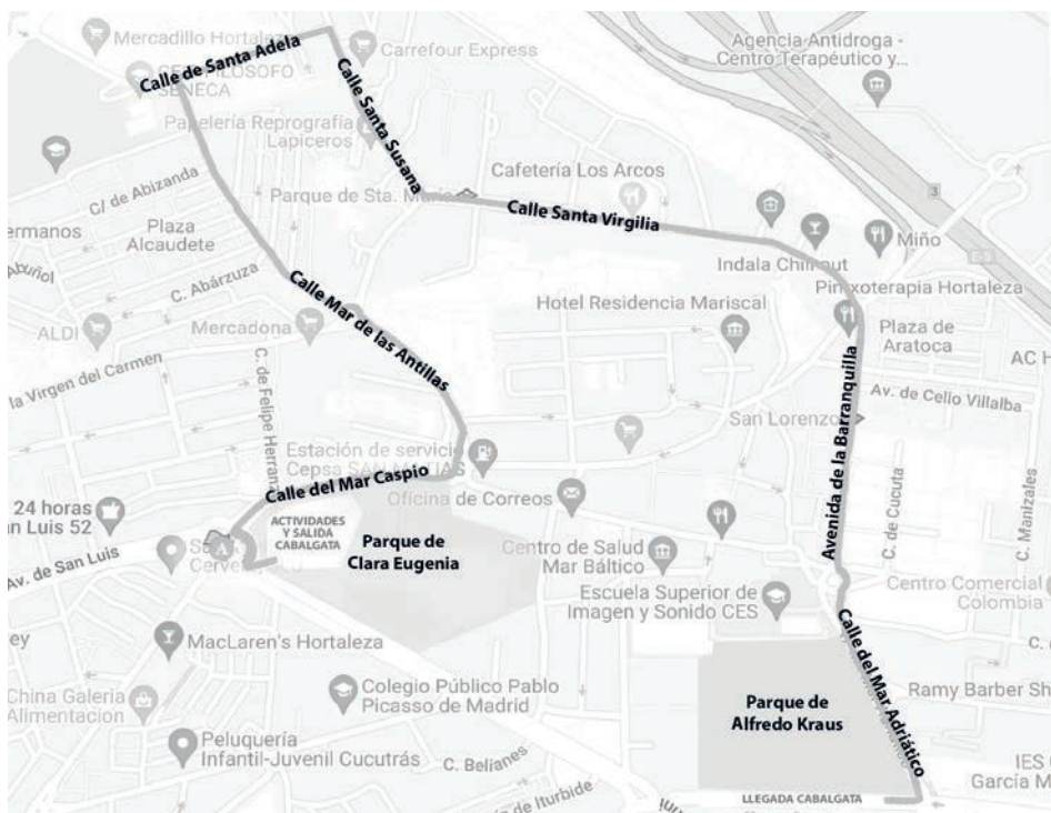
Mapa 3. Plano del itinerario de la cabalgata