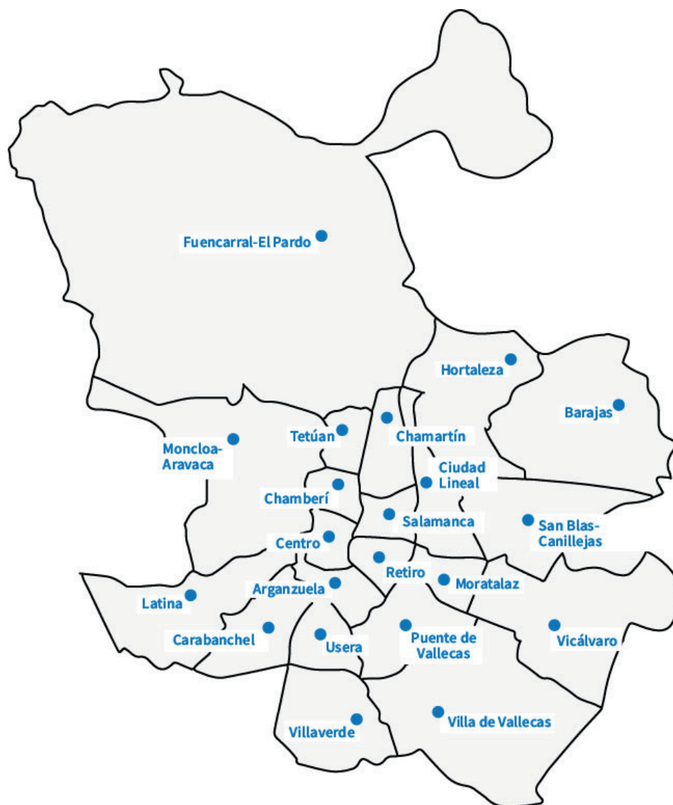
Mapa 1. Mapa por distritos del municipio de Madrid