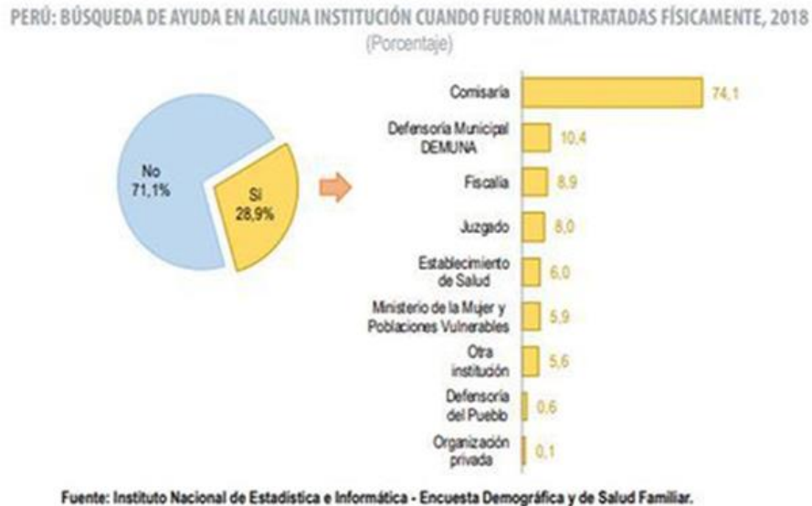
Figura 4. Víctimas de violencia bajo registro. Fuente: INEI/ENDES