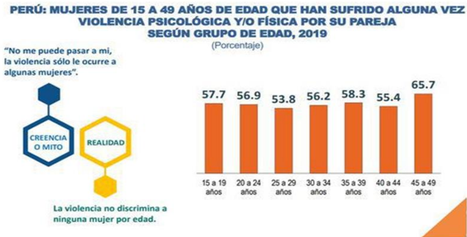
Figura 3. Víctimas de violencia según el grupo de edad.