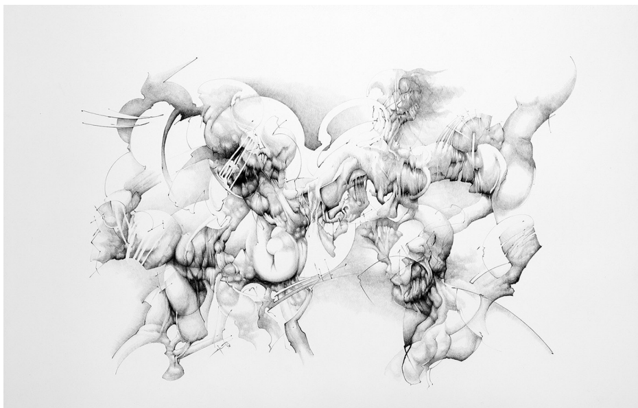
Un poco de veneno (2006). Grafito sobre papel: Julio Chavez-Guerrero Prohibida su reproducción en obras derivadas.

Asimismo, el art. 43, capítulo primero, título II de la carta magna hace mención a la naturaleza y a las características de la República del Perú cuando sostiene que “es democrática, social, independiente y soberana. El Estado es uno e indivisible. Su gobierno es unitario, representativo y descentralizado, y se organiza según el principio de la separación de poderes” (Congreso Constituyente Democrático, 1993). Tal situación no fue visible desde 1995, pues Fujimori estableció el abuso de autoridad en instituciones públicas, medios de comunicación, organizaciones