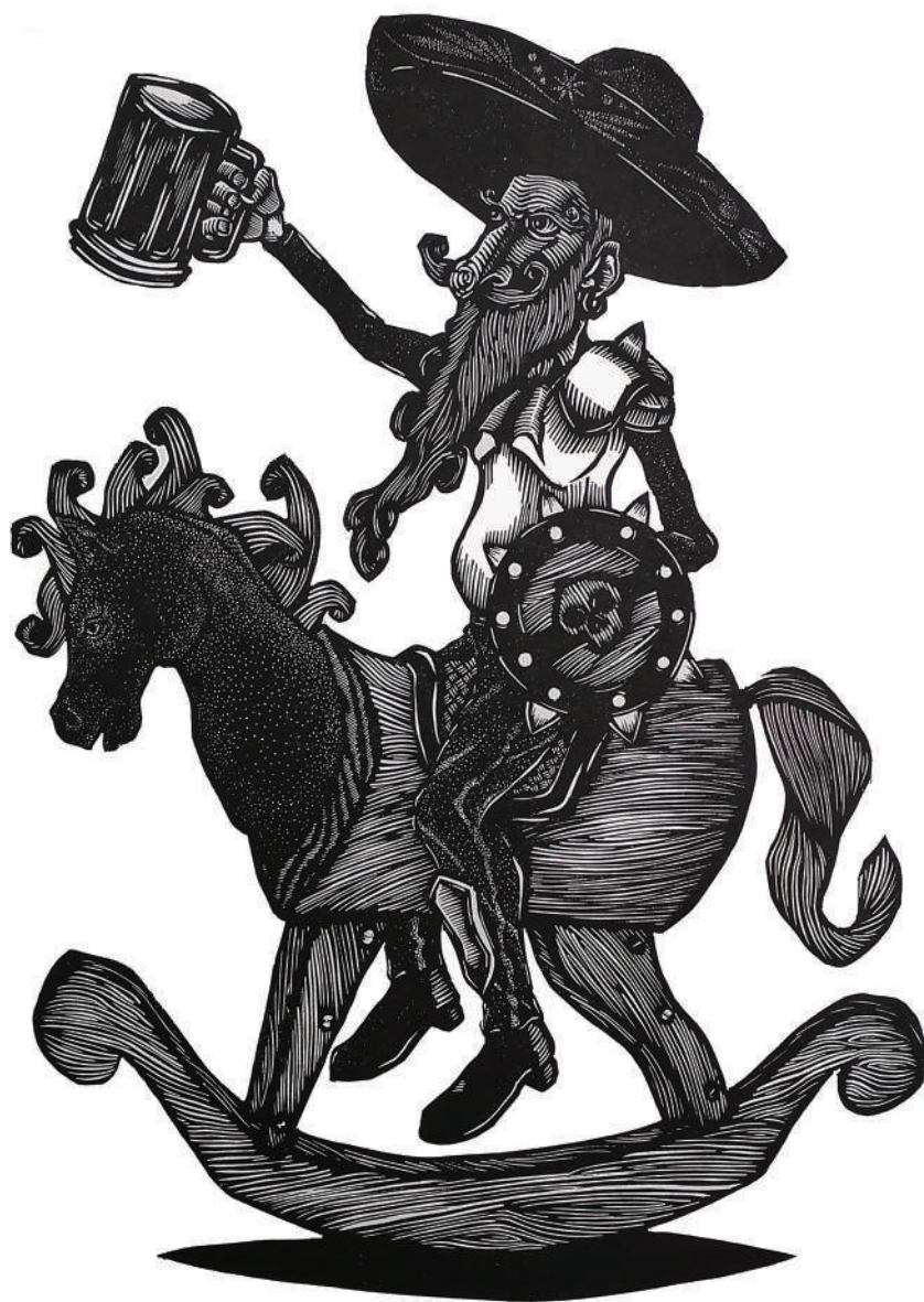
Sonador y Quijote (2020), Grabado en MDF: Juan Manuel Martínez Jaramillo. Prohibida su reproducción en obras derivadas.