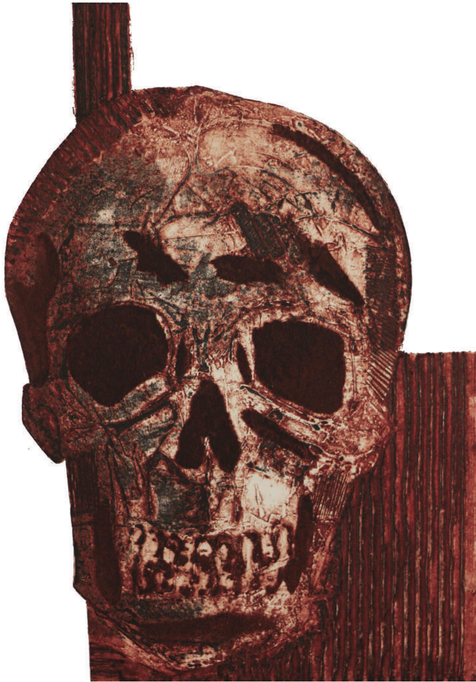
Suerte rima con muerte (2018). Colografía: Juan Manuel Martínez Jaramillo. Prohibida su reproducción en obras derivadas.