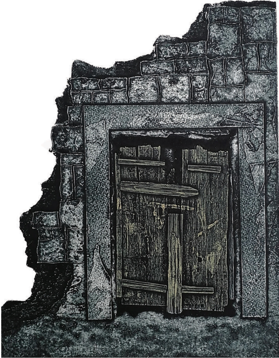
Memorias (2020). Colografía: Juan Manuel Martínez Jaramillo. Prohibida su reproducción en obras derivadas.