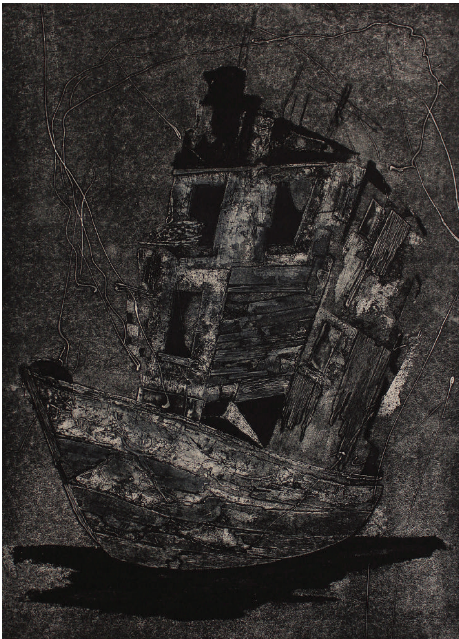
Corazón errante ( de la serie de los naufragios y reconstrucciones) (2020). Colografía: Juan Manuel Martínez Jaramillo. Prohibida su reproducción en obras derivadas.