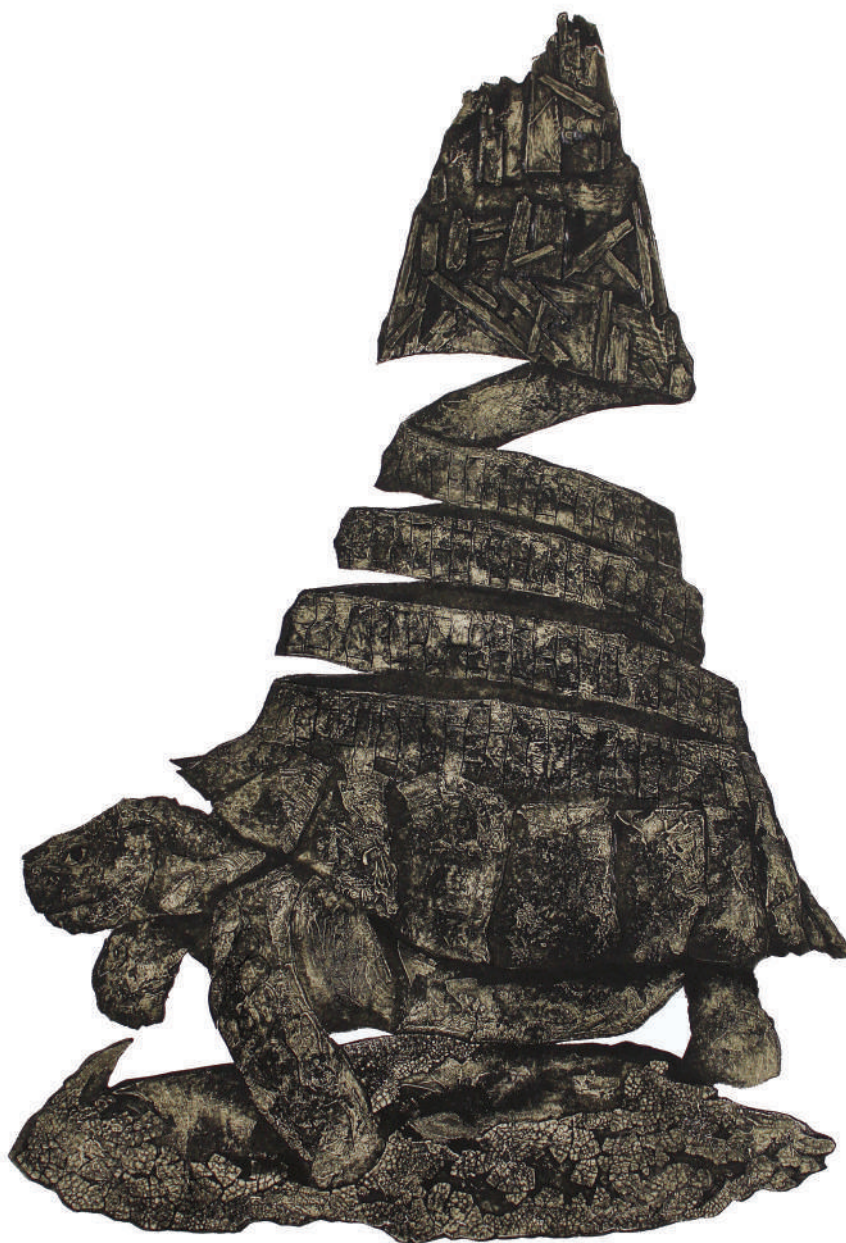
Las ruinas que habito (2021). Colografía: Juan Manuel Martínez Jaramillo. Prohibida su reproducción en obras derivadas.