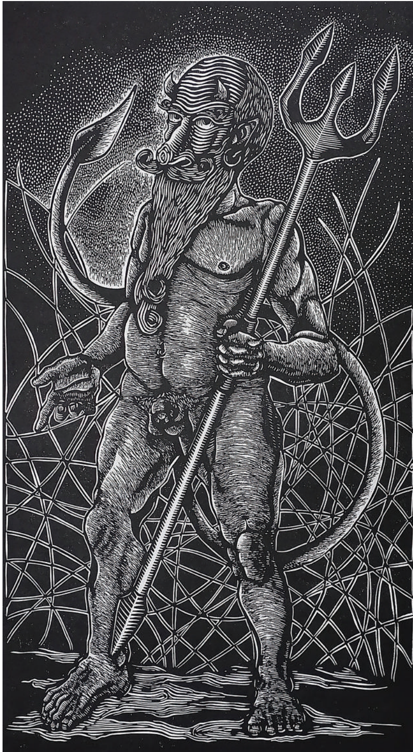
El amigo (2020). Grabado en MDF: Juan Manuel Martínez Jaramillo. Prohibida su reproducción en obras derivadas.