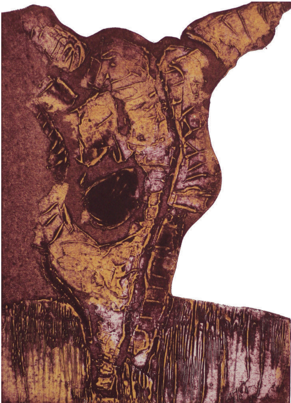
Incertidumbre y muerte. (2018). Colografía: Juan Manuel Martínez Jaramillo. Prohibida su reproducción en obras derivadas.