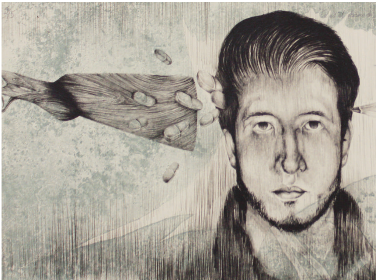
En el abismo de mis pensamientos, la muerte se disfraza de medicina (2018). Litografía en seco: Juan Manuel Martínez Jaramillo. Prohibida su reproducción en obras derivadas.

Juan Manuel Martínez Jaramillo. Licenciado en Artes Plásticas por la Escuela de Bellas Artes de Toluca (EBAT), México, con especialidad en Gráfica. Ha participado en las exposiciones colectivas: International Ex Libris Exhibition Skopje (Skopje Macedonia); Imagen Lírica (Estado de México, 2016); Sensaciones y Sentimientos (Estado de México, 2016); Calaca Tilica y Flaca (Estado de México, 2016); Aberraciones (Estado de México, 2017); Alfeñique (Estado de México, 2018); En nuestro Tiempo (Guanajuato, 2018); Los Colores de la Muerte (Coahuila, 2019); Las Intermitencias de la Muerte (Coahuila, 2019); High Graphics 2020 (Tatarstan, Rusia) Reminiscencias (Estado de México, 2021); Holguín, Relieve de una Vida (Estado de México, 2021). Recientemente, presentó su primera exposición individual Las Ruinas que Habito en el C. C. U. Casa de las Diligencias, Toluca, Estado de México.