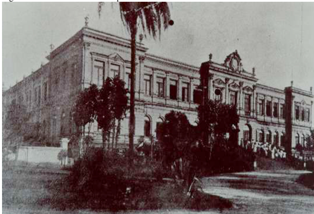
Figura 2. Escuela normal de la capital en 1906

Continuando con el proceso de expansión de las escuelas normales, el gobierno del Estado de Minas Gerais, mediante la ley n.º 439 del 28 de septiembre de 1906 19 , estableció la Escuela Normal en la ciudad de Belo Horizonte, reglamentada y constituida el 21 de marzo de 1907. Conocida como Escuela Normal Modelo, tenía como finalidad de preparar a las jóvenes de la sociedad de Belo Horizonte para el magisterio mediante una práctica metodológica —un novedoso modelo científico— que se diferenciaba de las demás escuelas, gracias a lo cual obtuvo notable protagonismo. La Escuela Normal Modelo, que se convirtió en un referente de la educación pública en Minas Gerais, fue transformada en el Instituto de Educación de Minas Gerais (IEMG), el 28 de febrero de 1946, mediante el decreto 1666 20 , actualmente la escuela más grande de la red estadual, el Instituto de Educación Estatal del Patrimonio Histórico y Artístico del Estado de Minas Gerais.