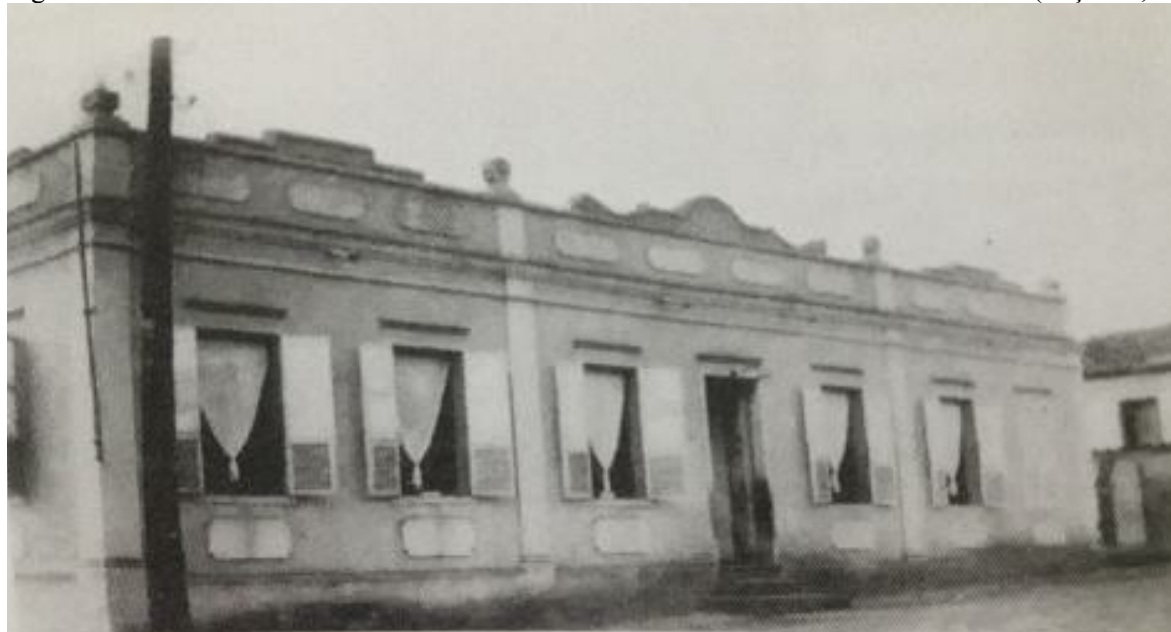
Figura 4. Fachada de la Escuela Normal Oficial Dr. Antônio da Cunha Pereira en 1914 (Peçanha, MG)

La figura 4 muestra el edificio donde se instaló la escuela, en el centro de la ciudad de Peçanha, cuando comenzaron las obras. El lugar satisfacía muy bien la demanda de espacio de los estudiantes con una excelente construcción y era elogiado por los inspectores regionales y otras personas que lo visitaban, como consta en el Libro de Actas de Inspección.