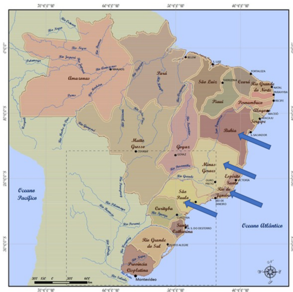
Mapa 1. Provincias de Brasil en 1822 y localización de las escuelas normales