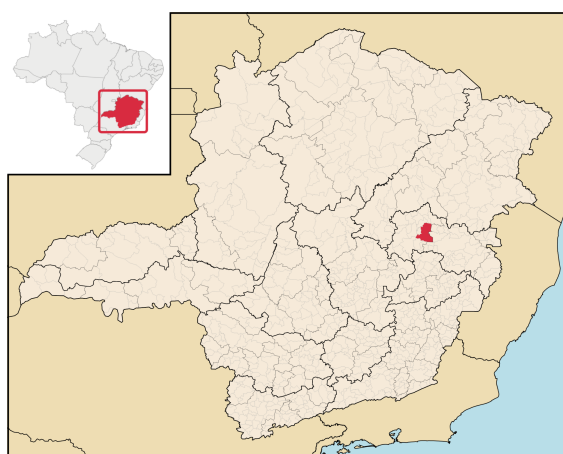
Figura 3. Ubicación de la ciudad de Peçanha, en el Estado de Minas Gerais, Brasil.