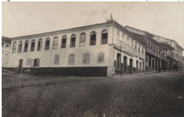
Figura 1. Sede de la Escuela Normal de Ouro Preto (1910-1925)