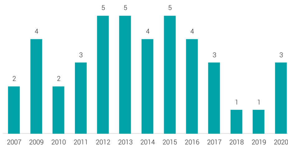
Figura 2. Ano de publicação das produções analisadas

No que se refere ao ano das publicações, o período variou entre 2007 e 2020, conforme pode ser observado na Figura 2 abaixo.