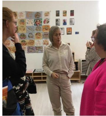
Figura 3 (izquierda). ANTÚNEZ DEL CERRO (2020). Obras expuestas en la muestra de Encuentros Creativos 2019.