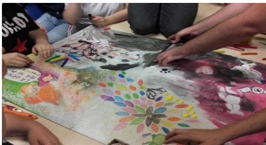
Figura 1. ANTÚNEZ DEL CERRO (2018). Participantes de la actividad piloto trabajando de forma colaborativa en una de las obras.

Después de estos contactos, se organizó una sesión dentro de la asignatura Artista, creatividad y educación 1 en la que artistas del COMCCP y los y las estudiantes de la asignatura compartieron un tiempo de creación conjunta. En este caso, sobre cartones grises de 100 x 70 cm y con diferentes materiales (témpera, acrílico, lápices de colores,...) se crearon obras colectivas, en las que cada cual iba interviniendo, pudiendo cambiar de un soporte / grupo cuando así lo quisieran (ver figura 1).