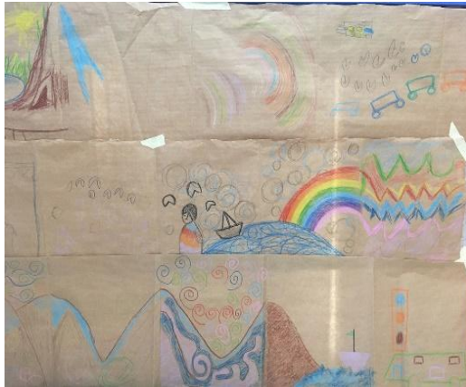
Figura 5. ANTÚNEZ DEL CERRO (2020). Paisajes realizados a través de la técnica del cadáver exquisito.