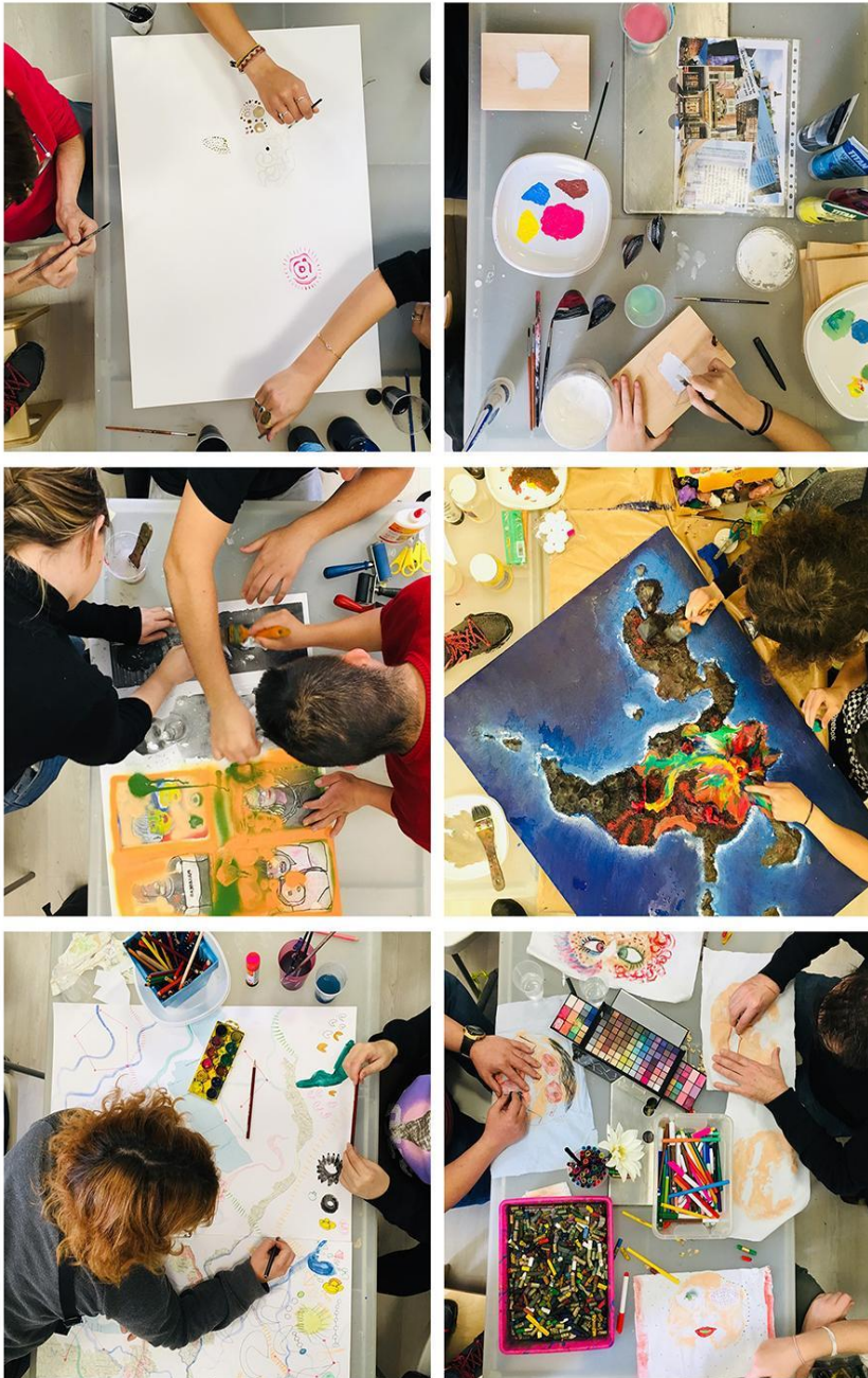
Figura 2. ANTÚNEZ DEL CERRO (2019). Grupos de artistas trabajando en sus proyectos.