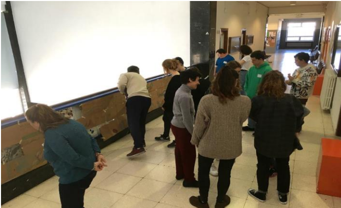
Figura 7. ANTÚNEZ DEL CERRO (2020). Participantes de Encuentros Creativos colocando y comentando las piezas realizadas en la sesión de presentación.

Como cierre del programa, se planteó la realización de una exposición final en la Sala de Exposiciones de la Facultad de Bellas Artes entre los meses de mayo y junio de 2020, que no llegó a celebrarse. En esta muestra se exhibirían tanto las obras generadas en la actividad como otras obras de los participantes, permitiendo entender a quien la visitara cómo este espacio y tiempo de creación conjunta había permitido generar vínculos y sinergias de experimentación y creación.