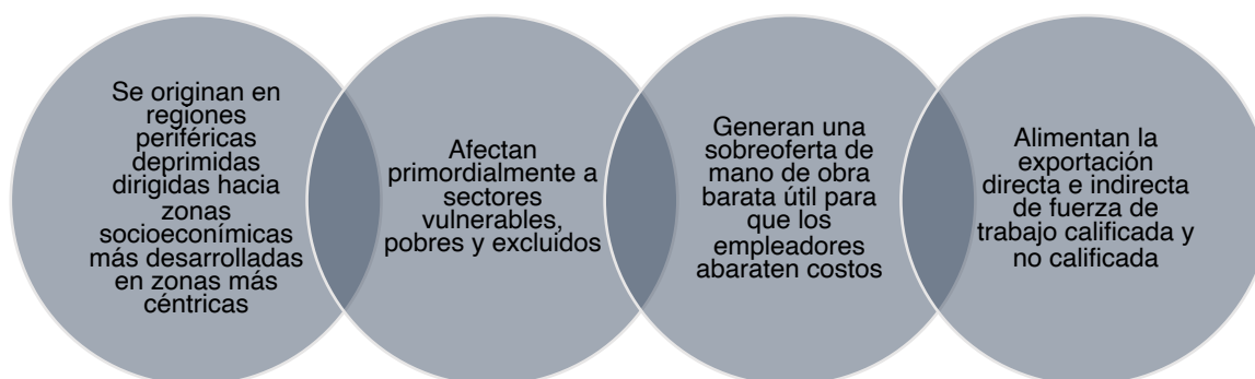
Figura 1. Características migración forzada

Elaboración propia, basado en Márquez y Delgado, (2011).