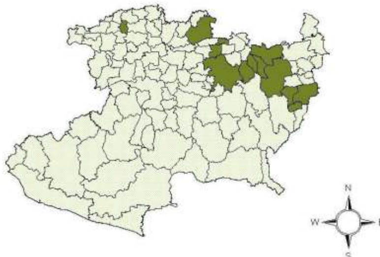
Figura 1 Ubicación geográfica de la Ruta de la Salud en Michoacán

La Ruta de la Salud comprende a los municipios del Estado de Michoacán los cuales son: Charo, Chucándiro, Cuitzeo, Hidalgo, Huandacareo, Indaparapeo, Ixtlán, Juárez, Jungapeo, Morelia, Queréndaro, Zinapécuaro y Zitácuaro. Se puede ver la Figura 1 donde se presenta la ubicación geográfica de la ruta turística.