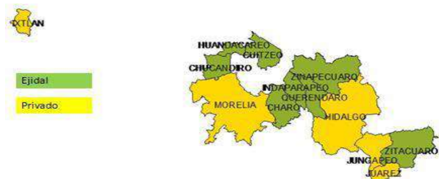
Figura 2 Régimen de tenencia de la tierra en la microregión de la Ruta de la Salud