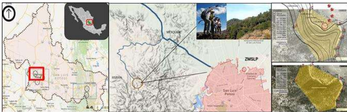
Figura 1. Localización del Parque Bioclimático Rivera. Centro Ecoturístico de Mexquitic de Carmona

A las faldas de la sierra de San Miguelito y cerca de la localidad de Rivera, al Occidente de la ciudad de Mexquitic de Carmona, a unos 8 km. se ubica una zona apropiada para establecer un Parque Ecoturístico de escala regional y nacional (ver Figura1).