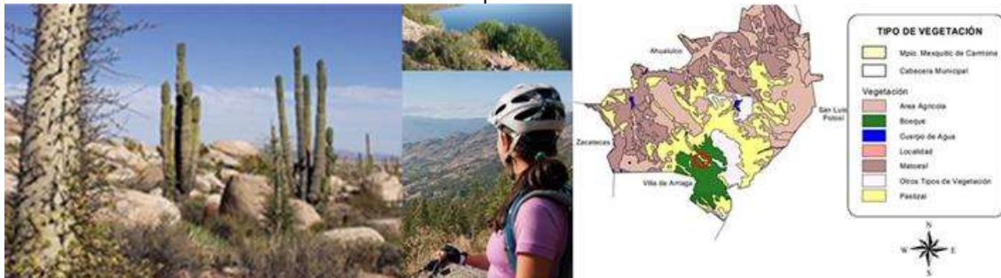
Figura 2. Potencial ecoturístico del Bosque de coníferas del Parque Bioclimático Rivera. Mexquitic de Carmona