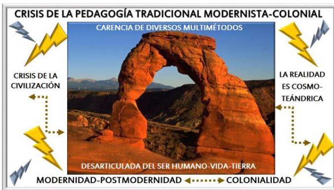
Figura 2. Realizada para la investigación 2020

En lo que sigue se presenta un gráfico del presente rizoma.