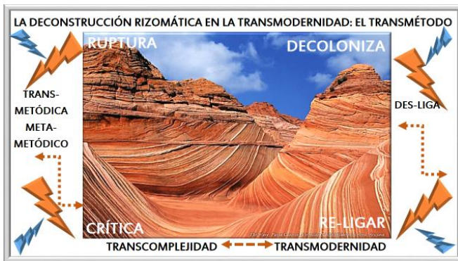
Figura 1. Realizada para la investigación 2020

En lo que sigue se presenta un gráfico del presente rizoma.