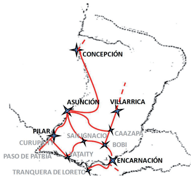
Figura 1. Mapa de las carreras de postas del Paraguay, 1843-1856. Elaboración propia a partir de un mapa del Paraguay antes de finalizar la Guerra Grande (1870) y documentos del ANA.

(estancia), entre otras; también hacia el norte había postas en Caaguazú, Ajos y San Joaquín.