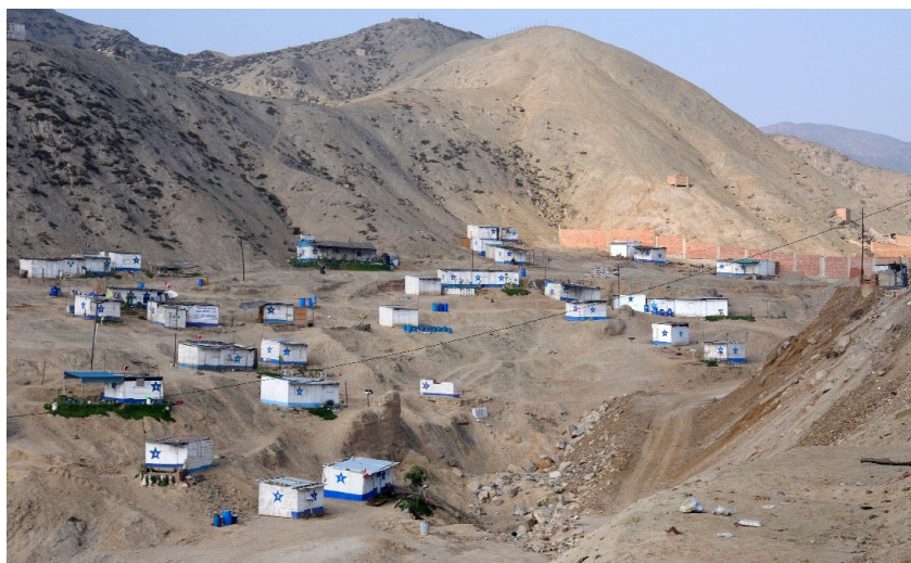
Gráfico 2. Lima. Periferias de la ciudad con carencias para un asentamiento humano, donde viven inmigrantes del campo recién llegados