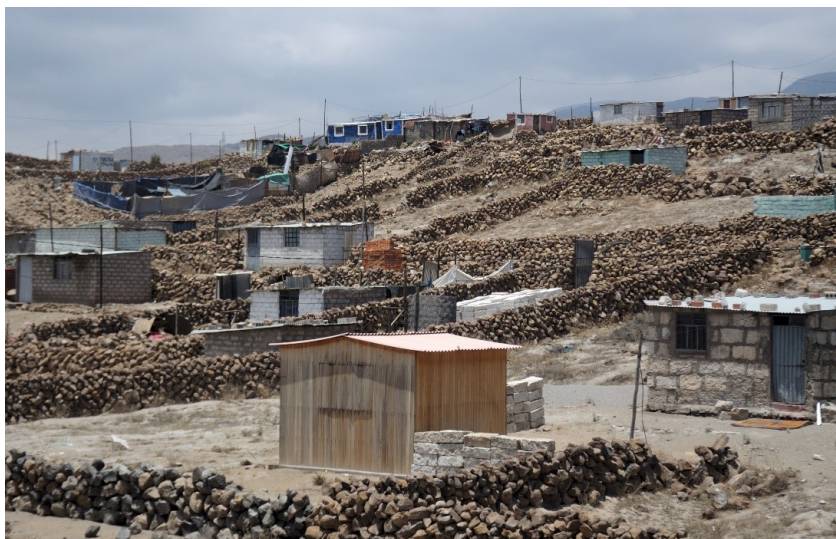
Gráfico 1. Arequipa. Lotización de tierras con suelos pedregosos, localizadas más arriba de la ciudad, con difícil acceso al centro y a los lugares de trabajo

Fuente: Mroslawa Cerny, archivo personal.