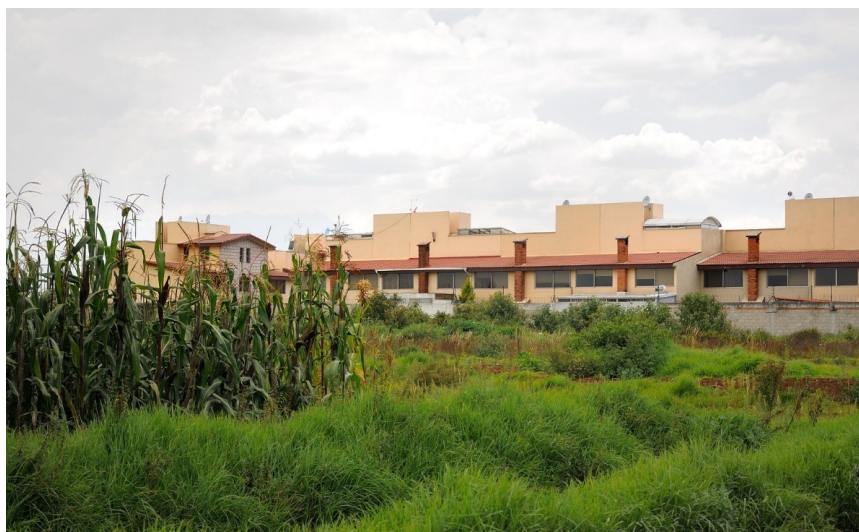
Gráfico 3. Toluca. Municipios periféricos de Toluca sujetos a procesos intensos de suburbanización