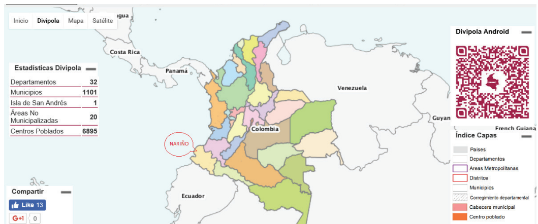
FIGURA 1. UBICACIÓN DEL DEPARTAMENTO DE NARIÑO EN LA DIVISIÓN POLÍTICO- ADMINISTRATIVA DE COLOMBIA