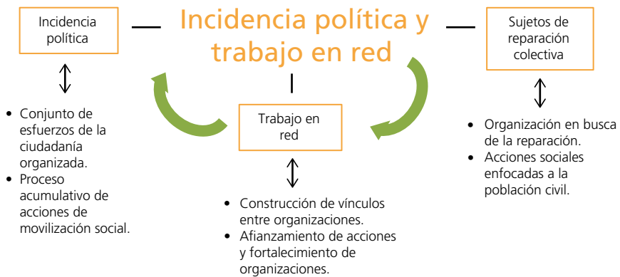
Gráfico 1. Categorías de análisis de la incidencia política y el fortalecimiento del trabajo en red