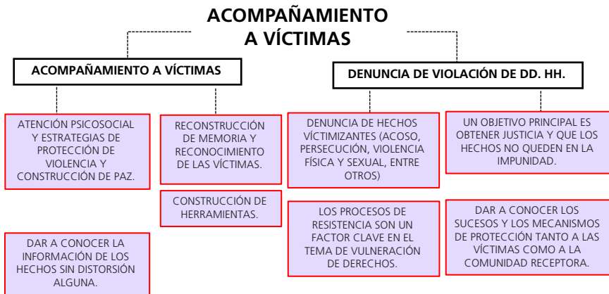
Gráfico 4. Acompañamiento a víctimas

Fuente: Alba, Giraldo, Zapata & Prieto (2017, p. 23).