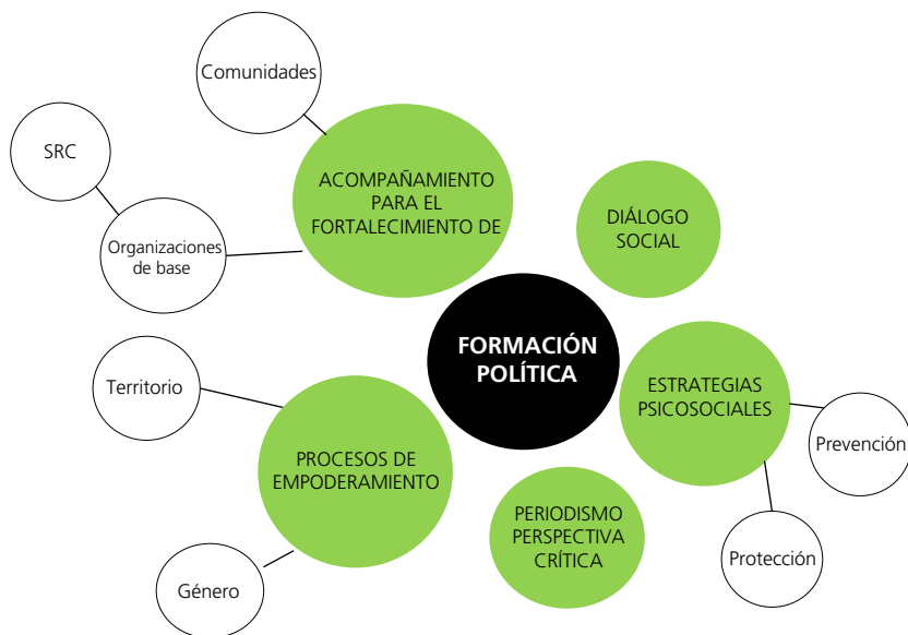
Gráfico 2. Acciones desde la formación política de los sujetos de reparación colectiva