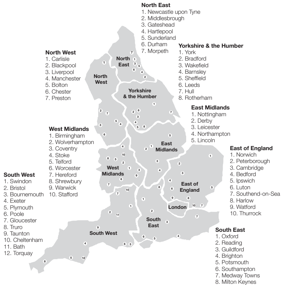
Mapa 1. Regiones de Inglaterra