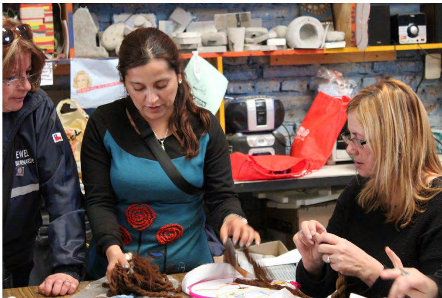
Figura. 5. Bordadoras del Taller de Crewel en la Casa de la Cultura de San Bernardo