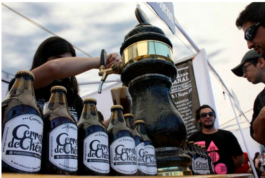
Figura 6. Cerveza Cerros de Chena

su sabor único y original. Además de sus excelentes propiedades, Cerros de Chena busca promover y rescatar los valores folklóricos y criollos de la ciudad de San Bernardo, que a su vez representan lo más propio de las costumbres y tradiciones chilenas (Figura 6).