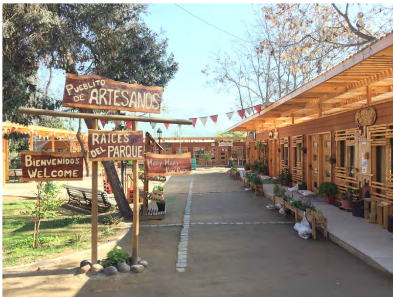
Figura 4. El pueblito de artesanos “Raíces del Parque”