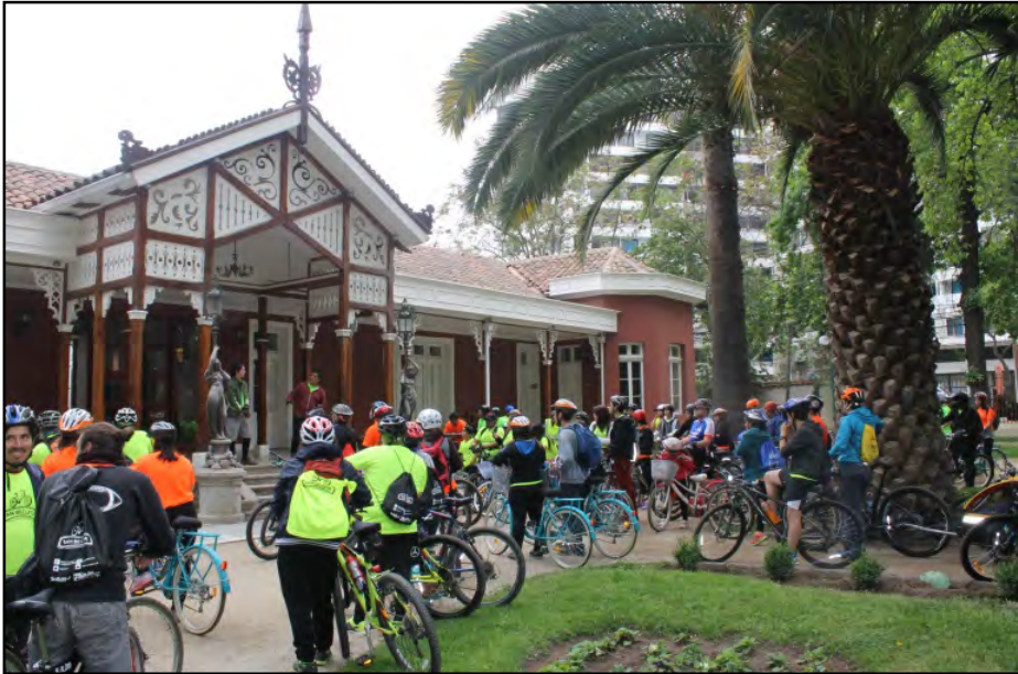
Figura. 3. Casa de la Cultura Magallanes Moure, punto de partida de la ciclo-ruta gastronómica