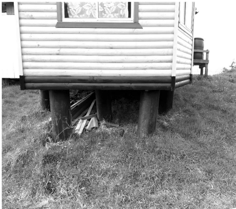
Figur 3. Cimientos de una vivienda insular fabricados con restos abandonados de la industria acuícola.