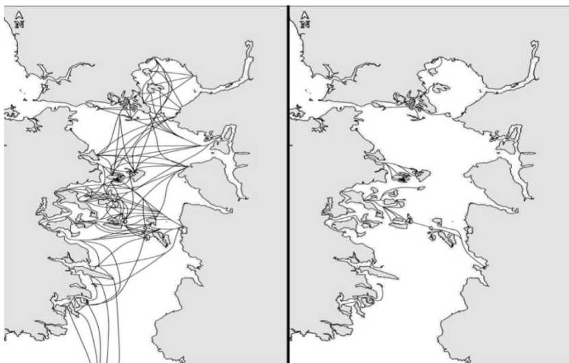
Figura 4. Trama histórica de movilidad entre islas que se sostenía tanto por razones productivas como festivas (Izquierda), y trama actual subvencionada por el Estado (Derecha).

Nos preguntamos, a propósito de lo anterior, ¿qué ocurrirá si el Estado decide suspender esta subvención?. La actual navegación es sustentada por una generación que envejece rápidamente (y que también se hace cargo de la agricultura y la pesca-buceo). Los más jóvenes, aquellos que se fueron pero pueden volver, ¿lograron aprehender esa habilidad náutica?. Navegar en los canales interiores requiere no sólo de conocimientos técnicos, sino que también de aquellos aprendizajes arraigados en la memoria colectiva, habilidad que ha sido tan valorada cuando se habla de los chilotes en la literatura histórica, Figura 4.