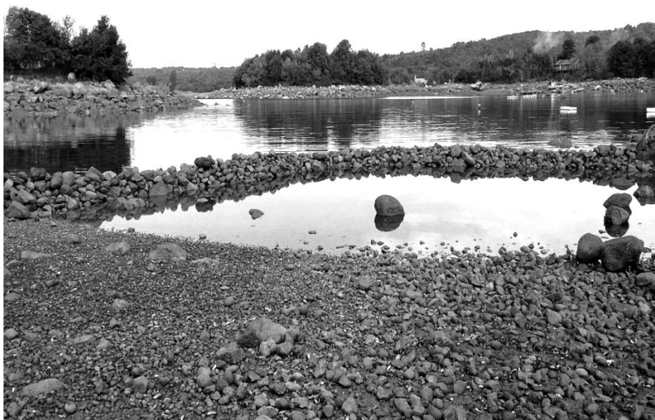
Imagen: Ricardo Alvarez (2016).