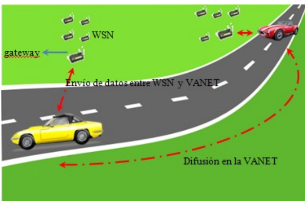
Figura 2 Diagrama del flujo de datos.

5. Transporte de los datos en los nodos móviles. Como se mencionó en el punto anterior, el movimiento de los vehículos permite la difusión de los datos dentro de la VANET. En caso de que haya pocos nodos móviles y se dificulte este envío, la WSN contribuye a difundir dichos datos. Los datos regresan a la WSN (en otro tramo posterior de la misma) basándose en la relevancia de los mismos. Esto permitirá que estén disponibles para cuando otro vehículo entre en cobertura y pueda recuperar la información pertinente.