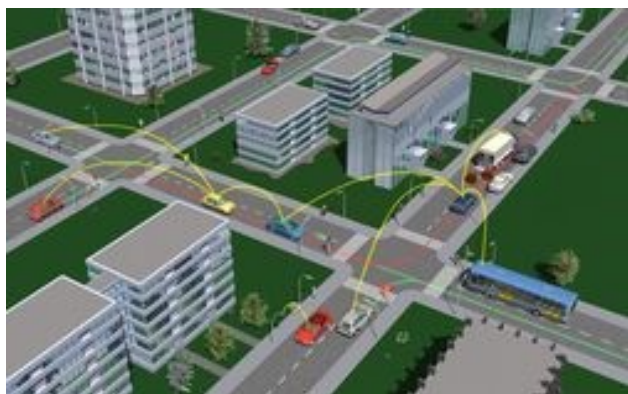
Figura 1 Aplicación de una VANET [2].

Considerando las características y beneficios que ambas redes ofrecen, recientemente se han iniciado estudios sobre la posibilidad de una combinación de ambas como una Red Híbrida Vehicular y de Sensores conocida por sus siglas en inglés HSVN (Hybrid Sensor and Vehicular Network) [3]. Esto posibilita que ambas trabajen juntas y puedan de esta manera fortalecer las debilidades de la otra. El objetivo de las HSVN es mejorar la seguridad vial.